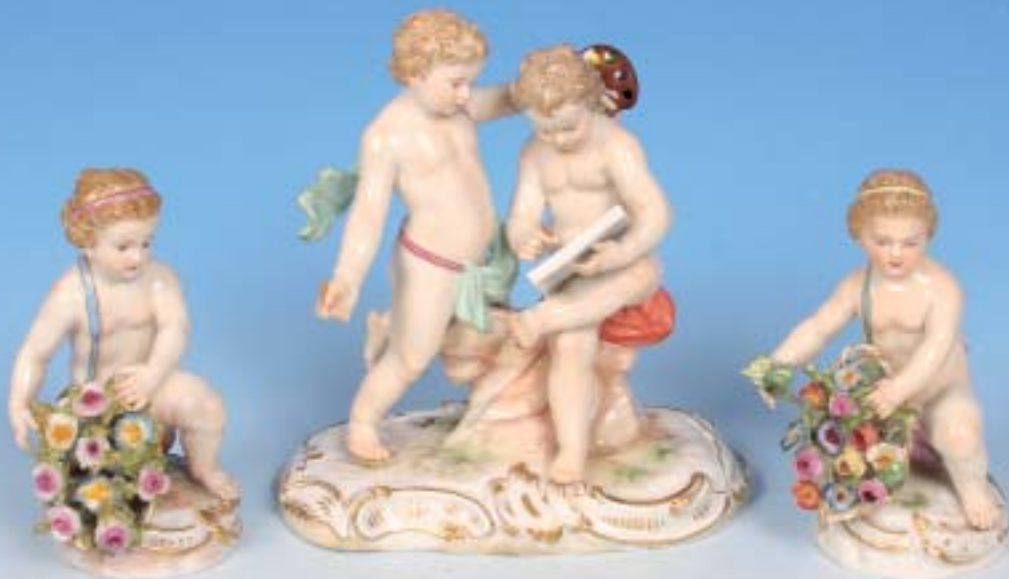
Kleine Gruppe: Gärtnerkinder Meissen 1860-1924

Dekor „Neubrandenstein“, feine Ziergoldränder. Im Spiegel „verschiedene Vogelmotive“. Hausmalerei. Meissen 1860-1924 Ø 23,5 cm