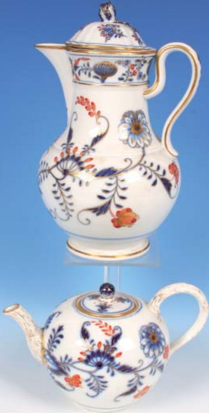
Schokoladen- und Teekanne „Zwiebelmusterdekor mit Koralle und Goldmalerei“. Meissen 1815-1860 H.: 25 u. 19 cm