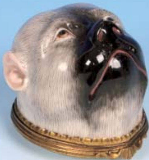
Mops-Dose Deckel innen und aussen mit „Watteauszenen“, Messingfassung. Modell von J.J. Kaendler Meissen 1815-1860 H.: 5,5 cm