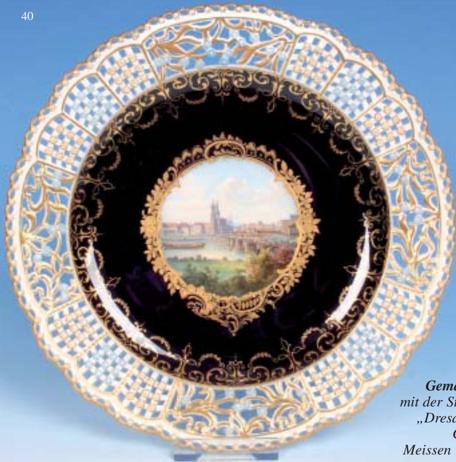
Musealer Gemälde-Teller mit der Stadtansicht „Dresden“ (nach Canaletto). Meissen 1815-1860 Ø 23 cm