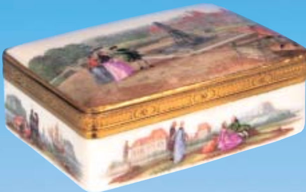
Kleine Damentabatiere feinste Qualität Wandung dekoriert mit verschiedenen „Sächsischen Landschaften“. (Original Messingfassung) Meissen 1740-1760 L.: 6,5, B.: 5,5 cm