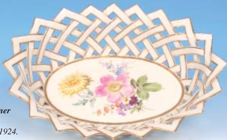
Fein geflochtener Früchtekorb. Meissen 1860-1924.