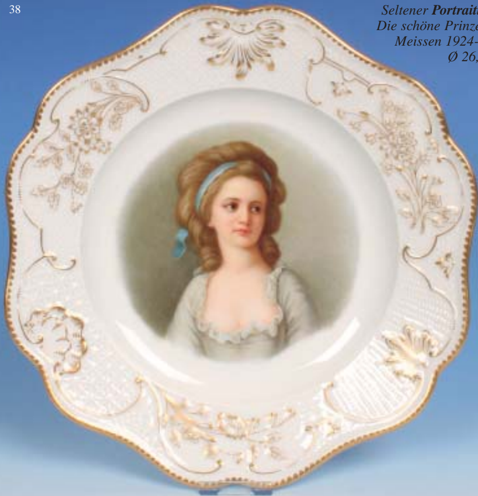
Seltener Porträtteller Die schöne Prinzessin. Meissen 1924-1934 Ø 26,5 cm