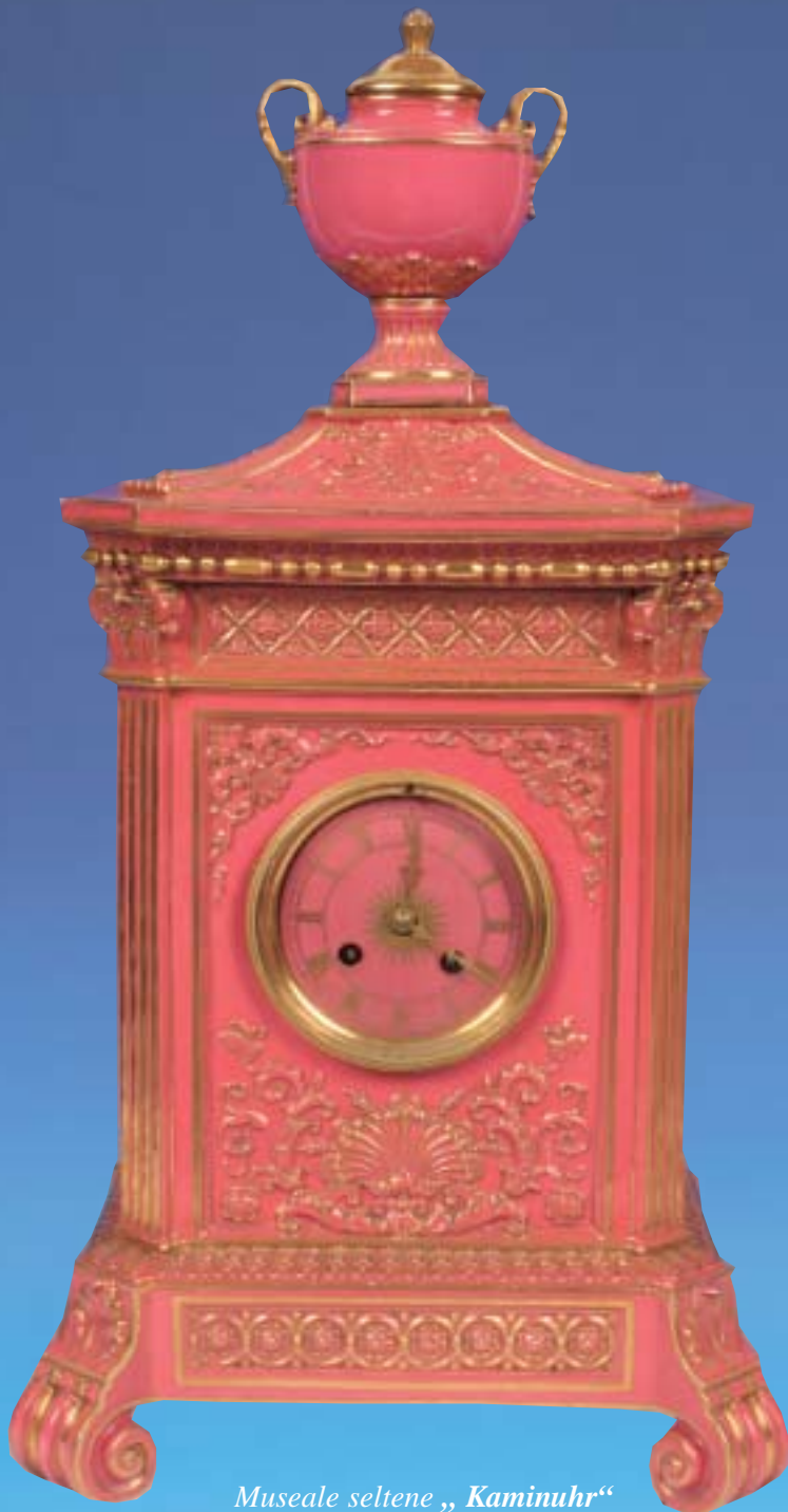
Museale seltene „Kaminuhr“ Klassizismus, rosafarbener Fond mit Goldstaffage, Porzellan-Zifferblatt. Französisches Uhrwerk, intakt. H.: 55 cm Meissen 1815-1860