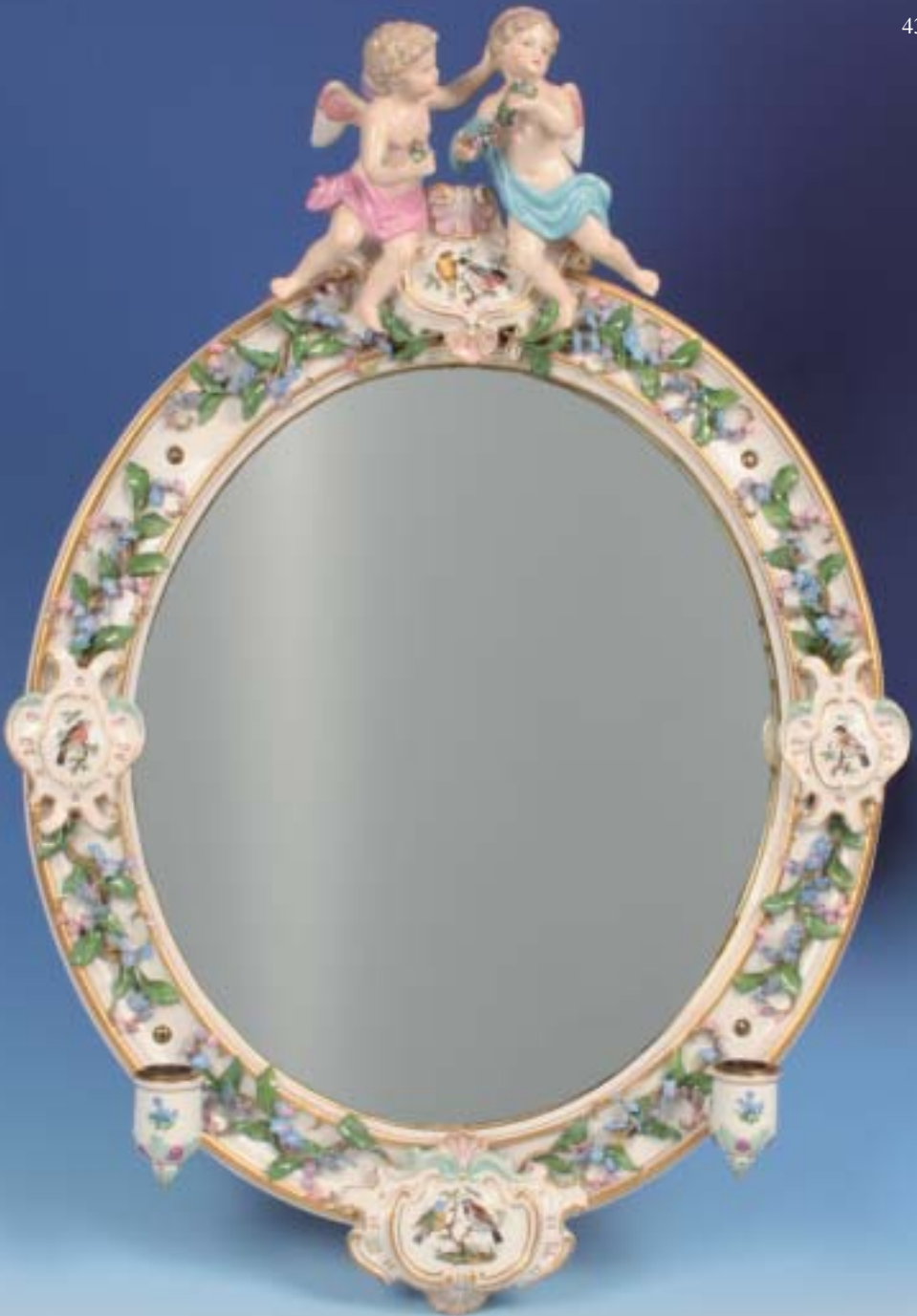
Aussergewöhnlicher „Spiegel“ Belegt mit plastischen Vergissmeinnichtblütenranken, sowie Kartuschen mit „Vogelmalerei“. Bekrönung von zwei Putten. H.: 54 cm Meissen 1815-1860