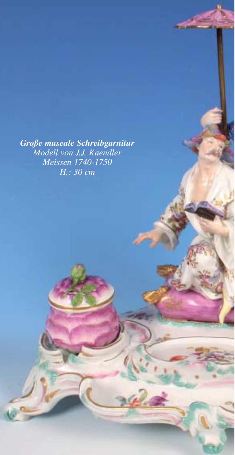
Große museale Schreibgarnitur Modell von J.J. Kaendler Meissen 1740-1750 H.: 30 cm