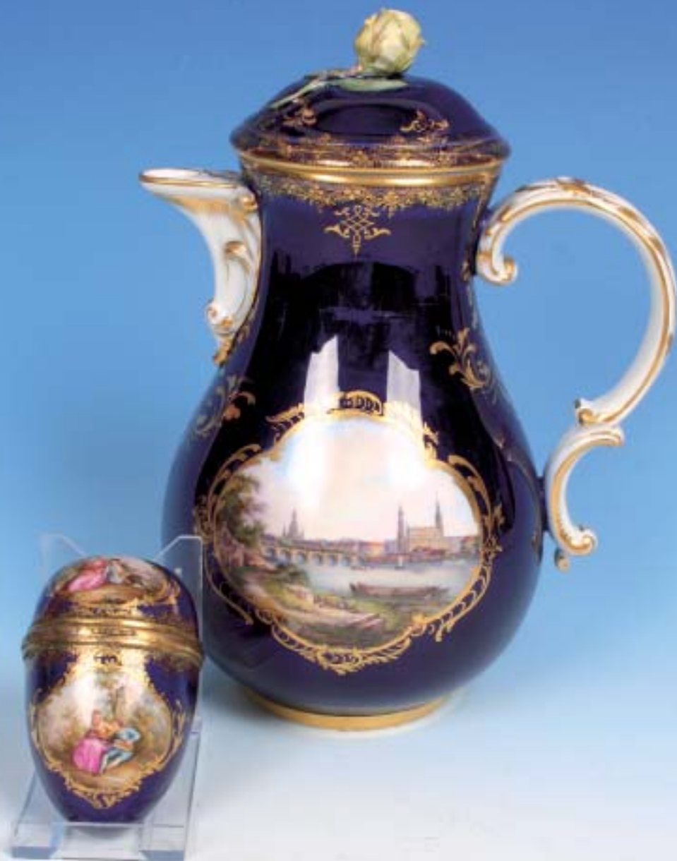
Kanne mit einer „Stadtansicht von Dresden“. H.: 23 cm. Dose in Eiform mit einer Szene, nach A. Watteau. Beide Teile mit kobaltblauem Fond und Goldbordürenstaffage. Meissen 1815-1924