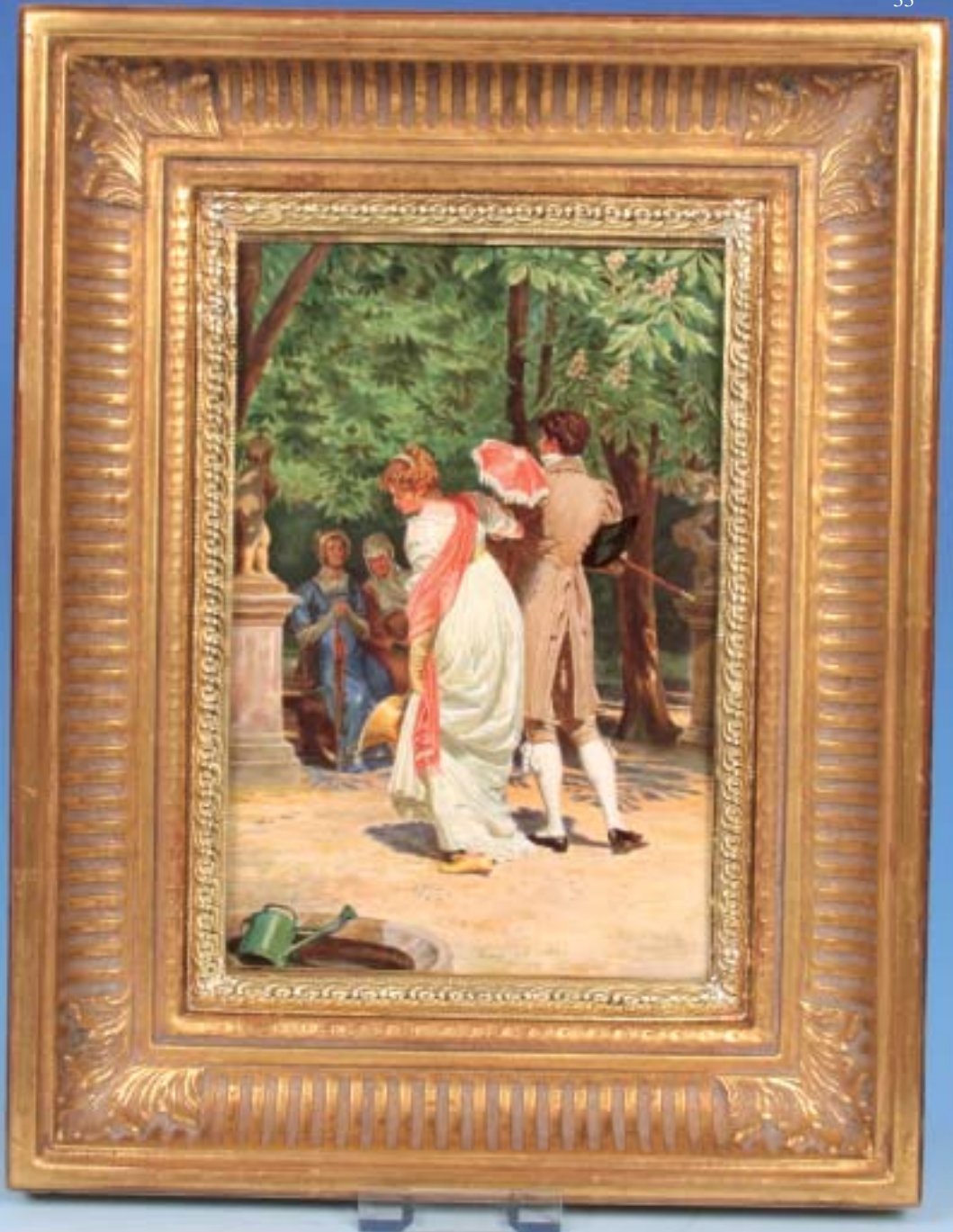
Bedeutendes Meissner Porzellanemalde „Das Rendezvous“ Meissen 1815-1860 (Unikat)