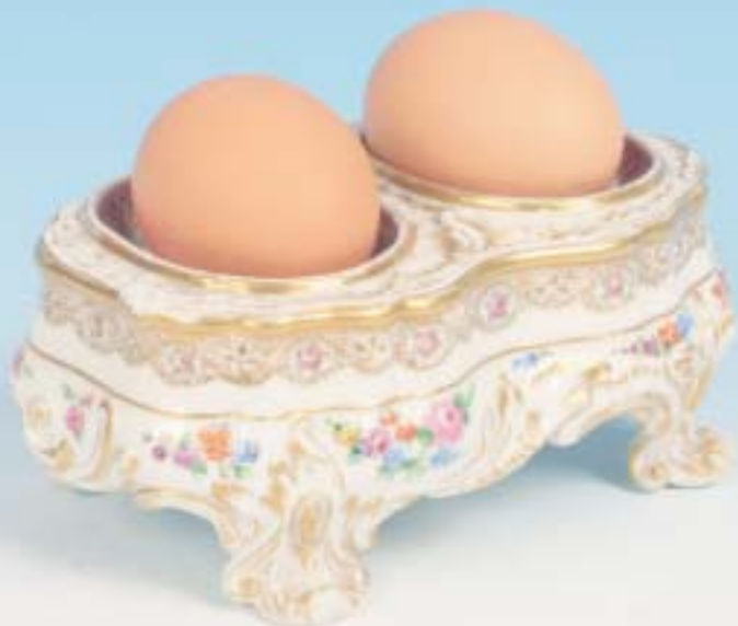
Seltener Eierbecher Barocke Form mit „Schuppenmosaik“. Meissen 1815-1860