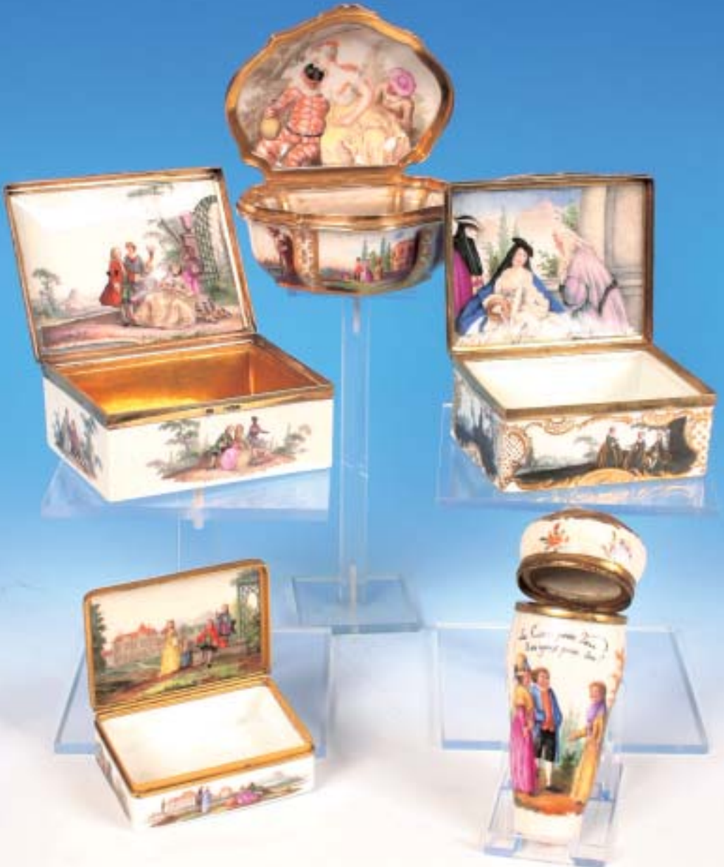
Verschiedene bedeutende Tabatieren/ Nadeletuis Meissen 18. Jahrhundert.