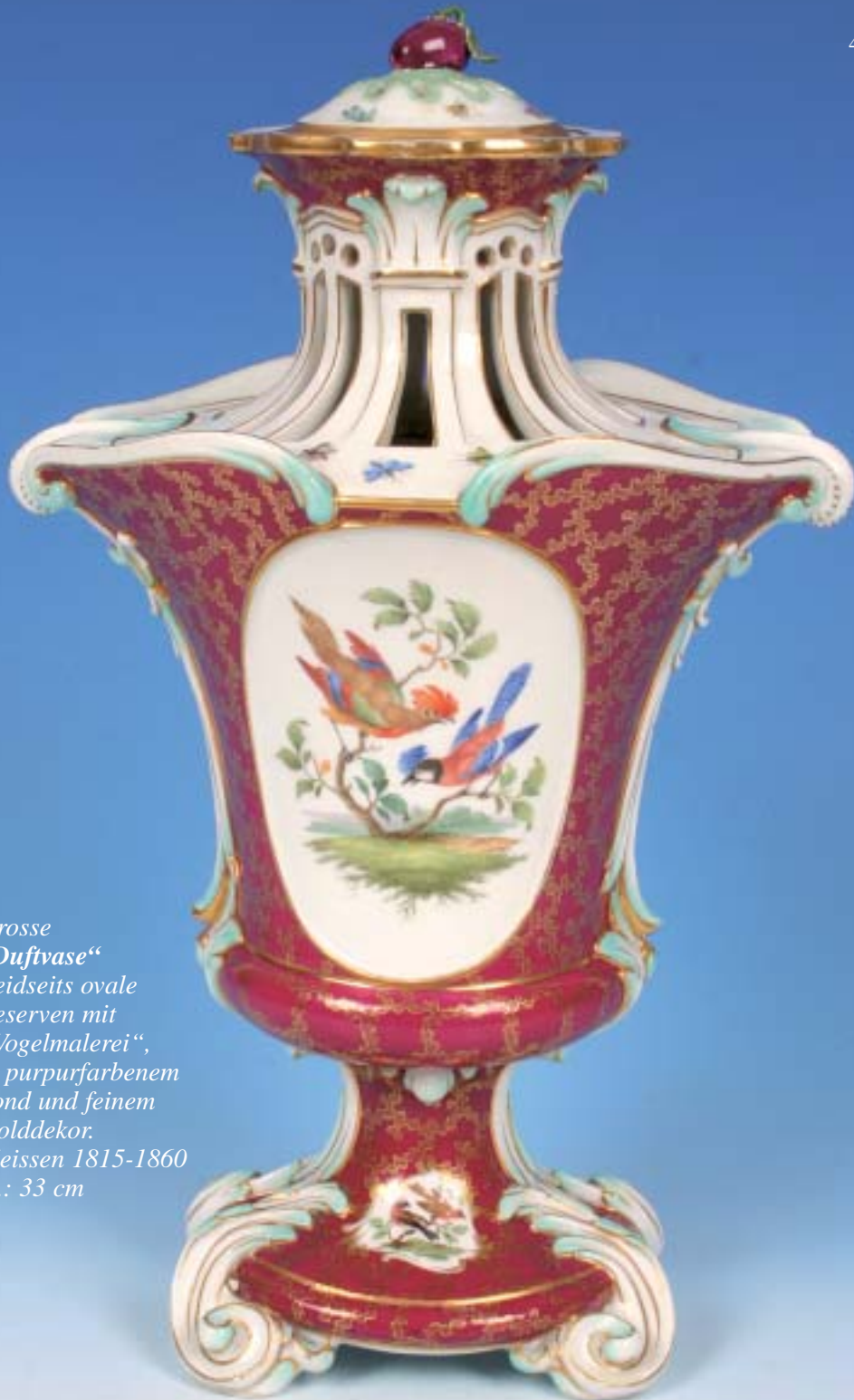
Grosse „Duftvase“ Beidseits ovale Reserven mit „Vogelmalerei“, in purpurfarbenem Fond und feinem Golddekor. Meissen 1815-1860 H.: 33 cm