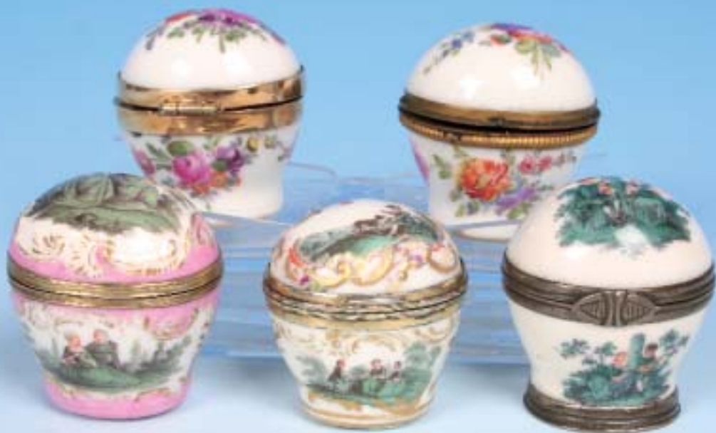
Fünf museale „Riechdöschen“ Meissen 18. Jahrhundert. 1750-1763 u. 1815-1860 H.: 3,5 cm