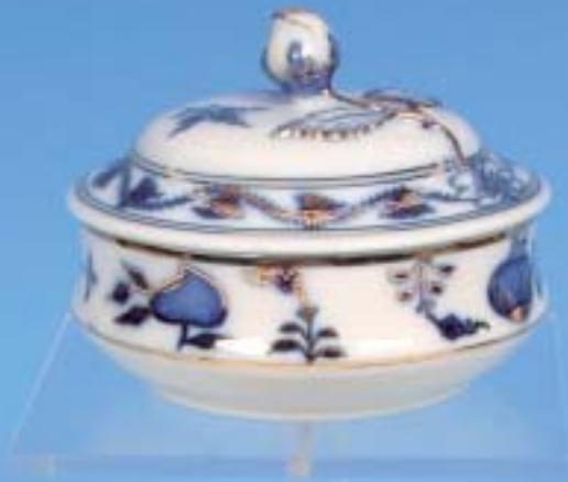
Vier verschiedene Deckeldosen „Zwiebelmusterdekor, Watteau- und Blumenmalerei, sowie bossierte Blüten und Blätter. Meissen 19. Jahrhundert