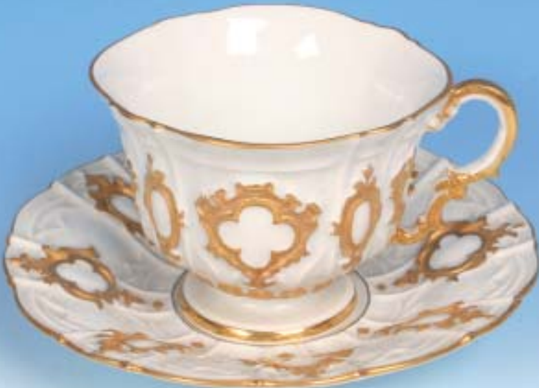
Tasse und Untertasse in „Pressglasoptik“ Reiche Goldstaffage. Meissen 1924-1934. H.: 8,5 cm