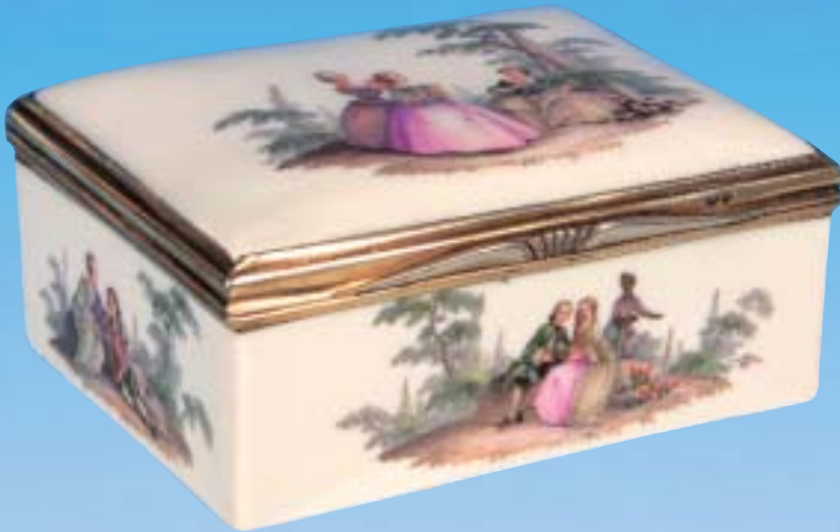
Schöne Tabatiere mit feiner Bemalung „Höfische Paare in idyllischer Landschaft“ nach A. Watteau. Original Goldfassung. Meissen 1750-1760 L.: 8,5, B.: 6,5 cm