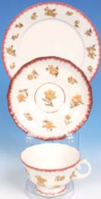
3-teiliges Gedeck Erhabene Blumen, Goldstaffage, korallenroter Rand. Meissen 1924-1945