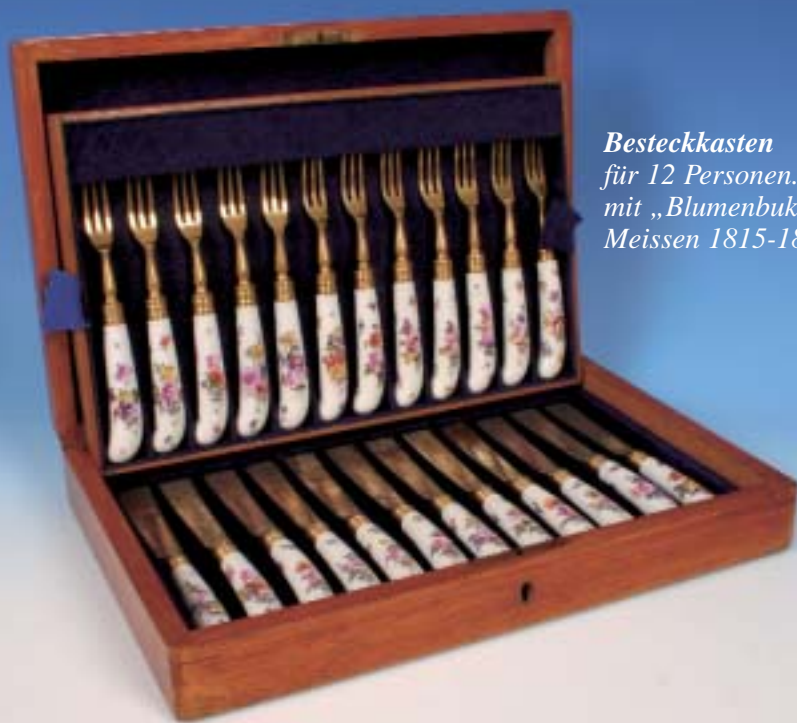
Besteckkasten für 12 Personen. Pistolengriffe mit „Blumenbukettmalerei“. Meissen 1815-1860