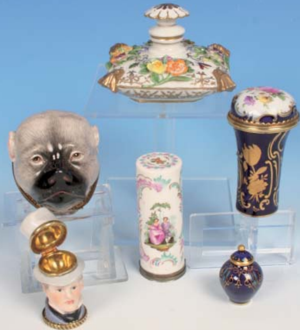
Verschiedene Exponate Kinder-Duftkissen bossiert mit Blütenbuketts. Mopsdose. Doppeldeckel-Pillendose in Form eines Kopfes mit Hut. Stockgriff-Dose. Zylinderdose und Miniaturväschen. Meissen 1815-1860