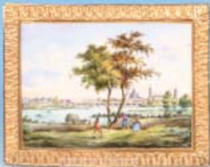
Zwei Miniatur-Gemälde. Meissen und Dresden. Meissen 1815-1860