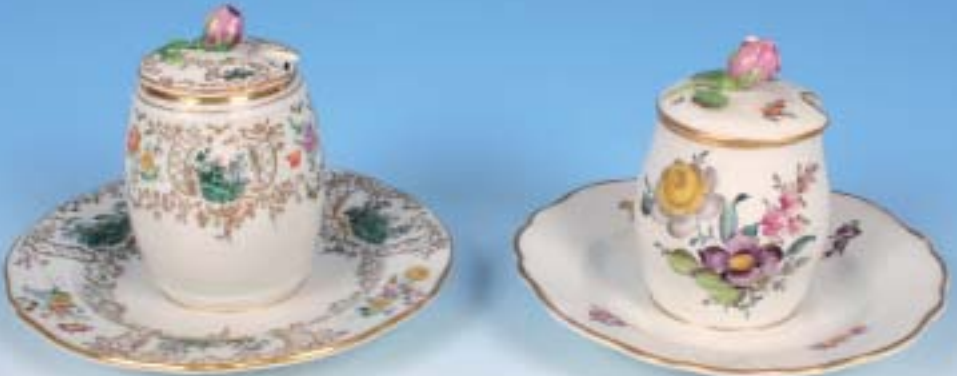
Zwei Konfitürenfässchen mit festem Präsentoir. Meissen 1815-1860 H.: 12 cm u. 10 cm