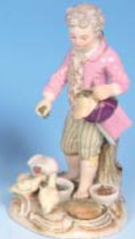
Gänsejunge und Hühnermädchen. Miniatur. Meissen 1815-1860.