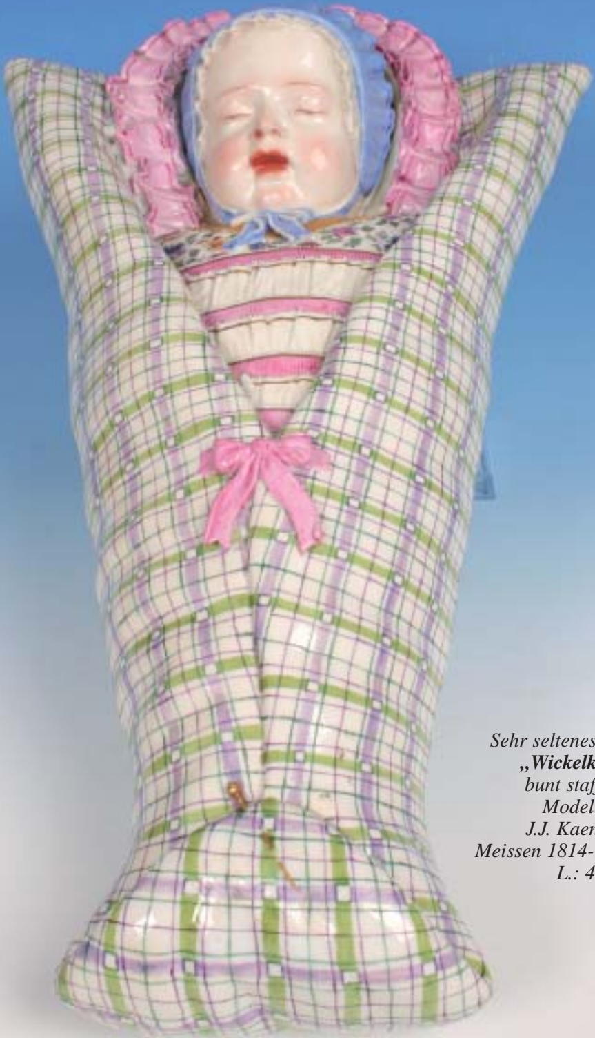
Sehr seltenes sog. „Wickelkind“ bunt staffiert. Modell von J.J. Kaendler. Meissen 1814-1816 L.: 41 cm