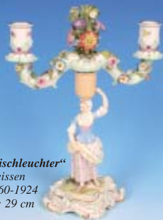
„Tischleuchter“ Meissen 1860-1924 H.: 29 cm