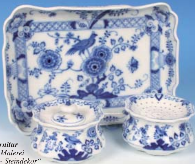
Grosse Schreibgarnitur Unterglasurblaue Malerei sog. „Fels,- Vogel,- Steindekor“ Meissen 1815-1860 L.: 27 cm