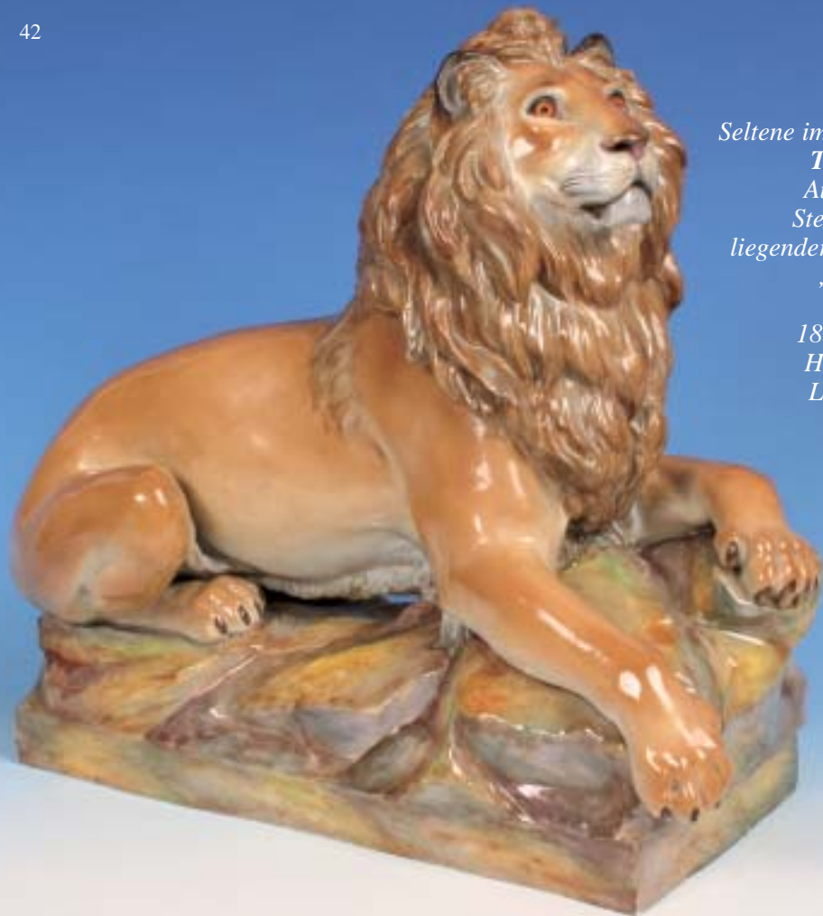
Seltene imposante Tierfigur Auf einem Steinsockel liegender, stolzer „Löwe“. Meissen 1815-1860 H.: 32 cm L.: 31 cm