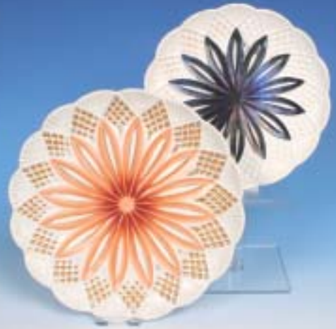
Zwei Teller in „Pressglasoptik“, blau, orange und gold staffiert. Meissen 1815-1860 Ø 18,5 u. 21,5 cm