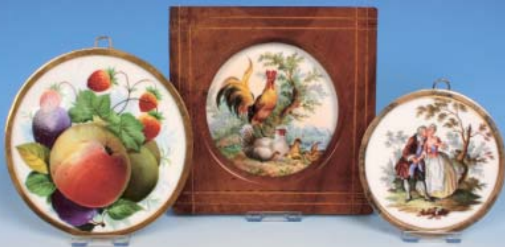
Drei verschiedene Porzellangemälde „Früchtestillleben, Federvieh und Watteauszenen“. Meissen 19. Jahrhundert