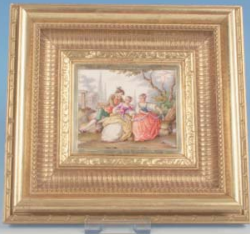
Kleines Meissenbild mit feiner Watteau- Malerei. Meissen 1815-1860