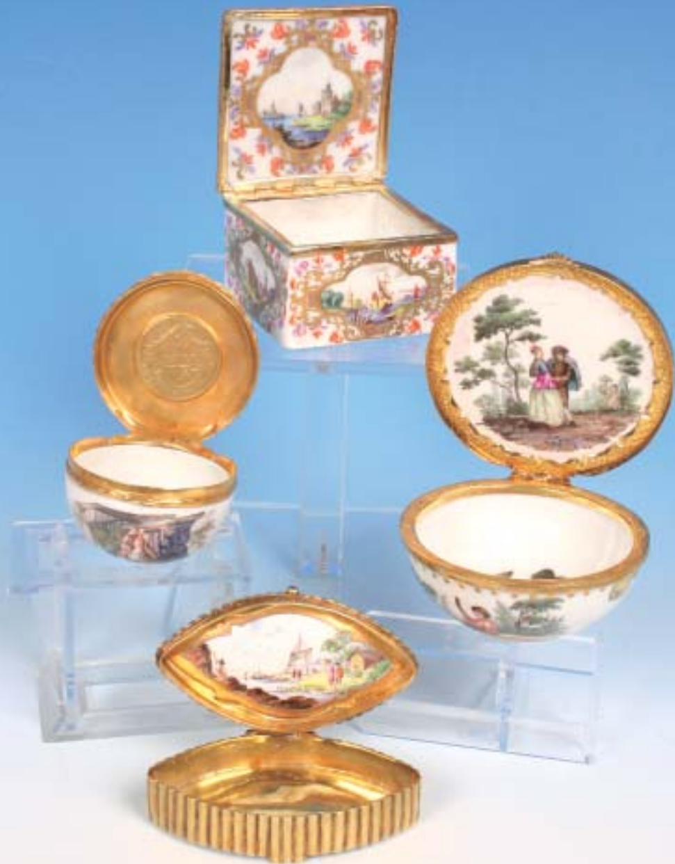
Vier verschiedene „Tabatieren“ Meissen 18. Jahrhundert