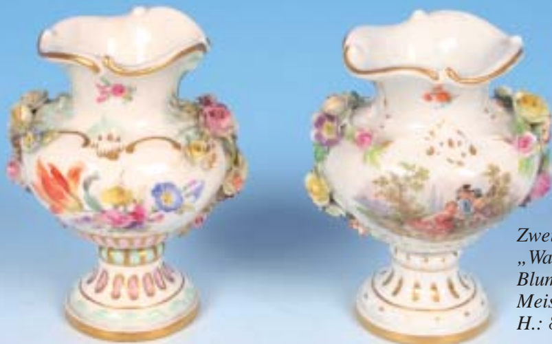
Zwei Zierväschen mit „Watteauszenen und Blumenbukettmalereien“. Meissen 1815-1860 H.: 8,5 cm