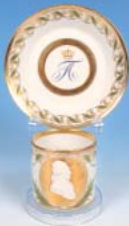
Prunktasse mit dem Bisquitrelief von „König Friedrich August I. von Sachsen“. Meissen 1815-1860 H.: 11 cm