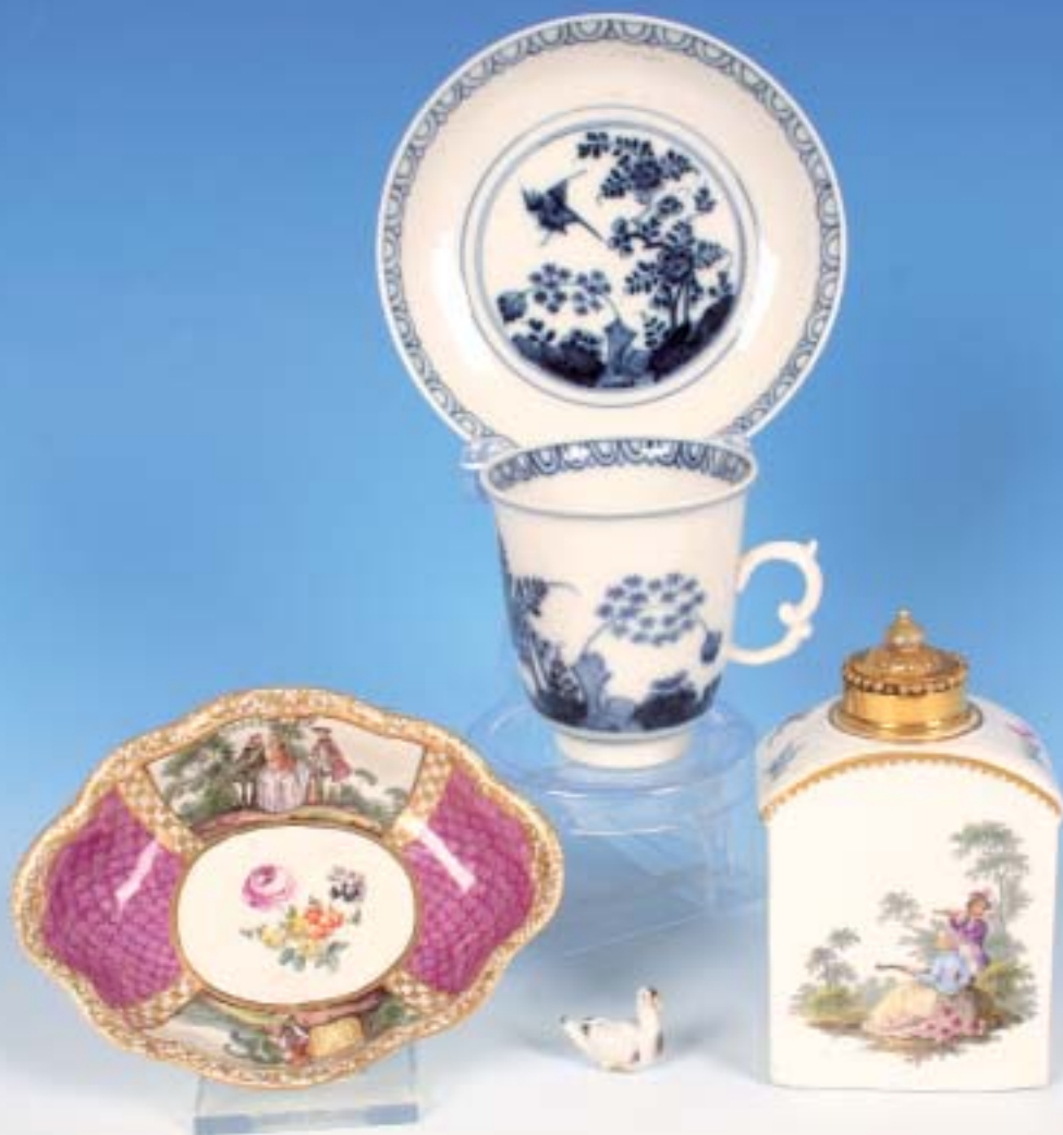
Schokoladentasse mit „Fels-Vogel-Dekor“, Schale in „Vierfelderoptik“, Teedose mit „Watteauszenen“ und Miniatur-Ente Meissen 1740-1760