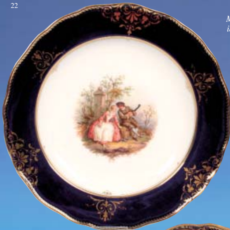
Teller Musizierendes Paar in idyllischer Landschaft Meissen 1860-1924 Ø 26 cm