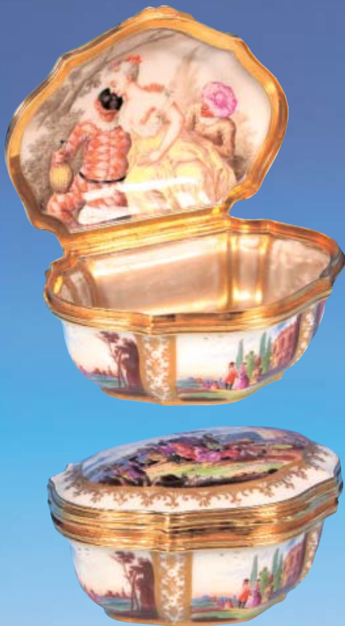
Museale, datierte Schnupftabaksdose Kartuschenförmig. Aussenseite mit fein gemalten „Sächsischen Landschaften“ in originaler Goldfassung. Im Deckelinnern „Harlekin und Columbine“. Meissen datiert 1741 L.: 9 cm, B.: 7 cm