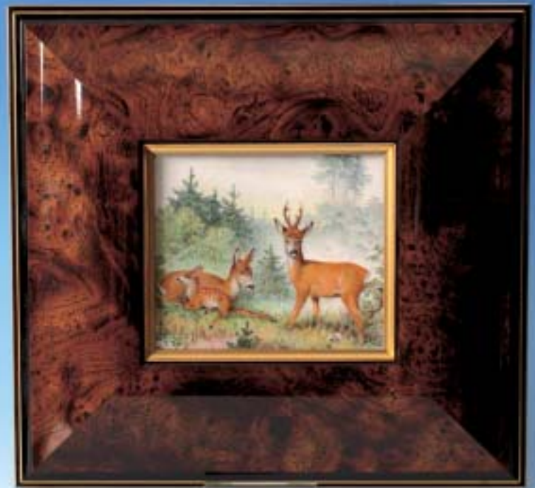
Porzellan- Miniatur „Rehe auf der Lichtung“ Beamtenporzellan Meissen 1935-1945 24 x 24,5 cm