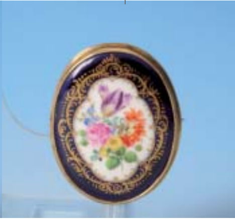
Porzellan-Brosche „Blumenbukett“ Meissen 1935-1945 Ø 4,5 cm