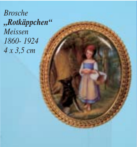
Brosche „Rotkäppchen“ Meissen 1860- 1924 4 x 3,5 cm