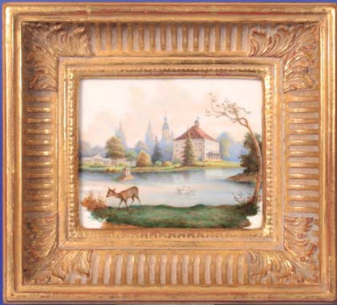
Porzellan-Gemälde „Großer Garten in Dresden“ im Hintergrund die Türme der Frauenkirche, Hofkirche, Kreuzkirche. Meissen 1860-1924 15 x 20 cm