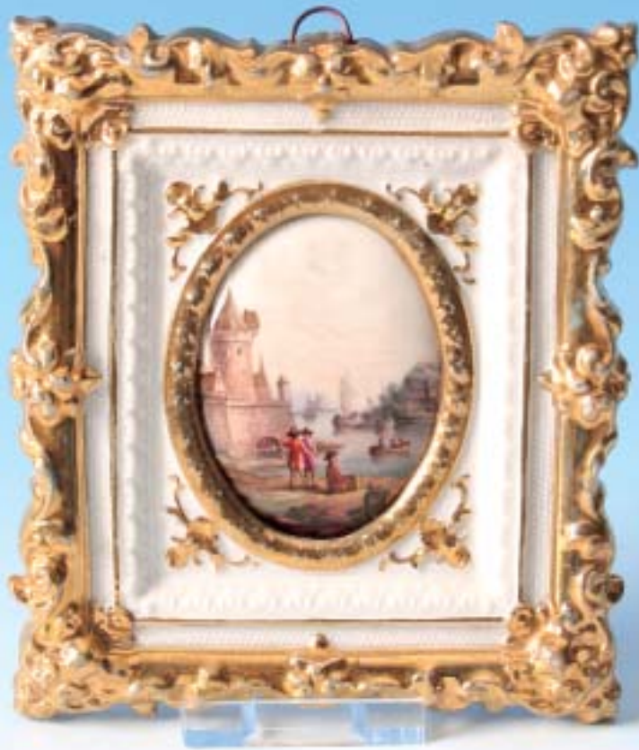
Porzellan-Miniatur „Italienische Hafenlandschaft“, im Porzellanrahmen, sehr selten. Meissen 1815-1860 11 x 10 cm