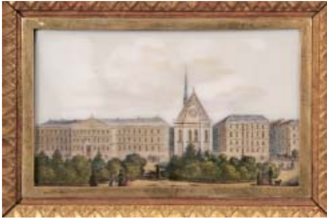
Zwei Porzellan-Miniaturen Universität „Leipzig“ u. „Landschaft mit Personenstaffage“, nach einer Stichvorlage gemalt. Meissen 1815-1860 25 x 20 cm