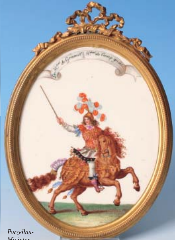
Porzellan- Miniatur „Le Marschal de Gramont“, aus dem Carousell im Dresdner Zwinger. 16 x 11 cm Meissen 1815-1860