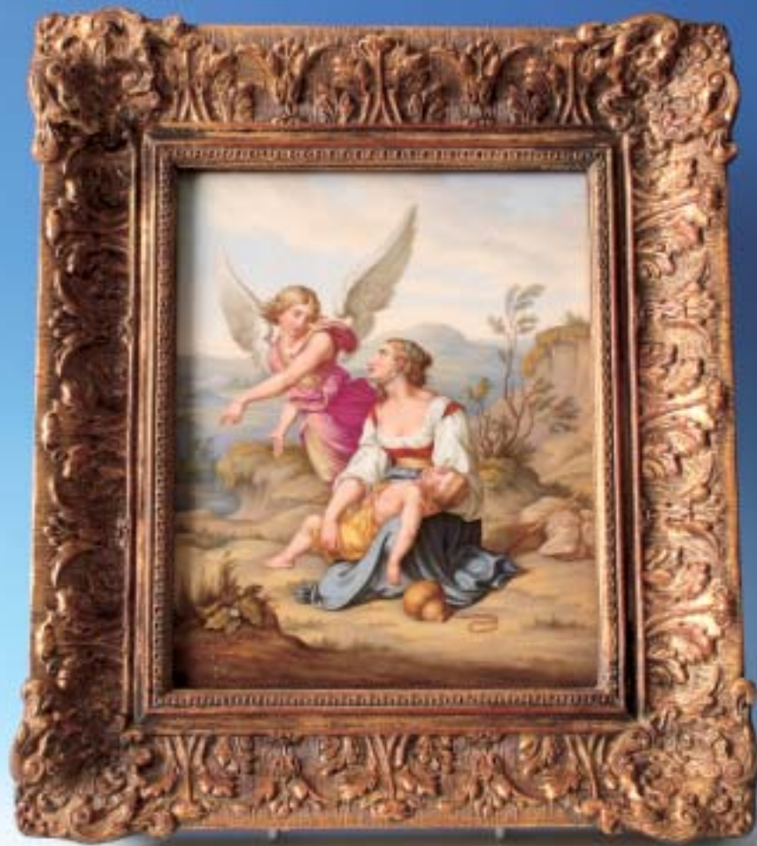
Porzellan-Gemälde 35 x 30 cm „Hagar und Ismail“ Meissen 1815-1860