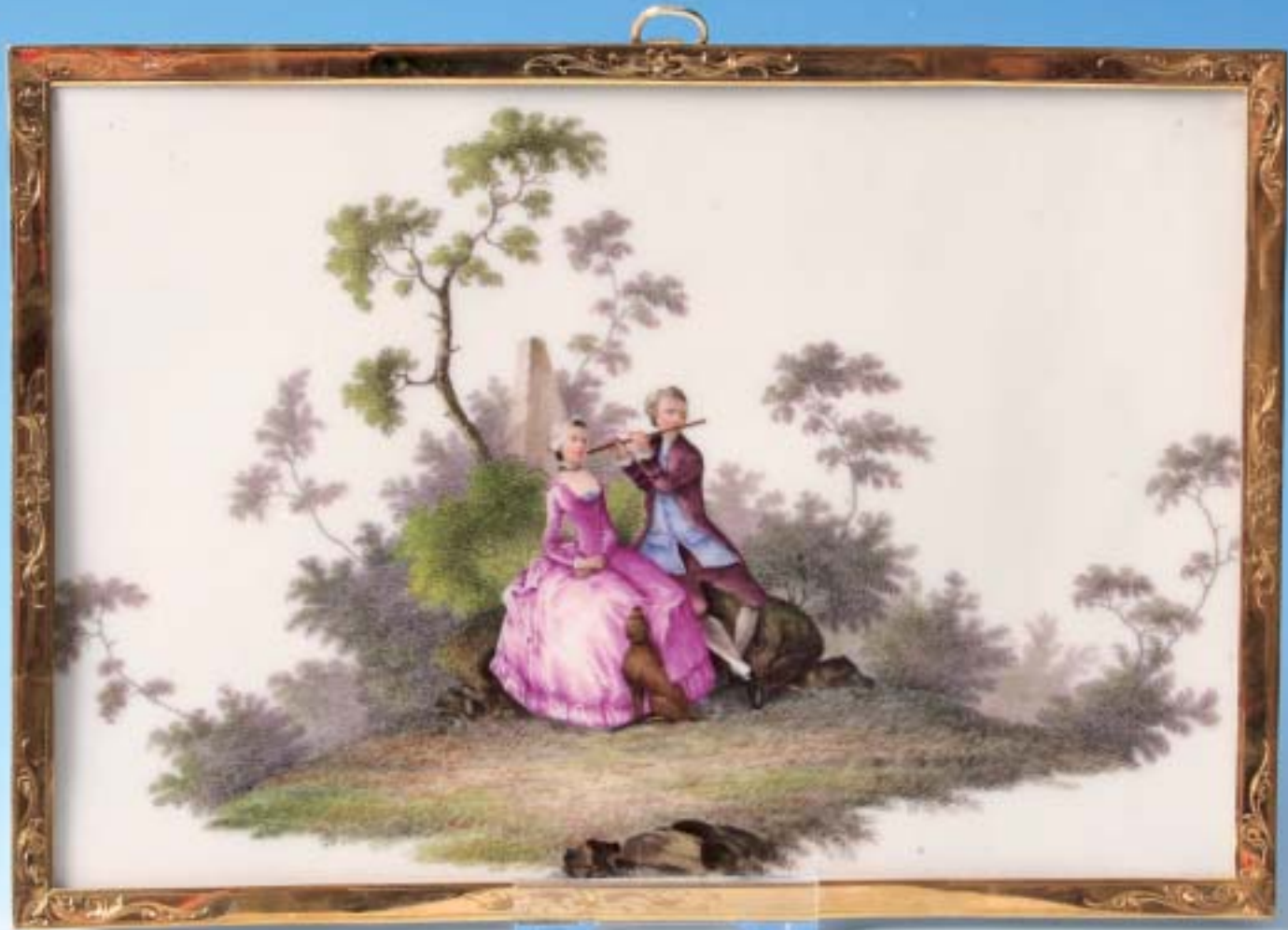
Porzellan-Gemälde „ Höfisches Paar im Park “, n. A. Watteau. 16 x 22,5 cm Meissen 1740-1750