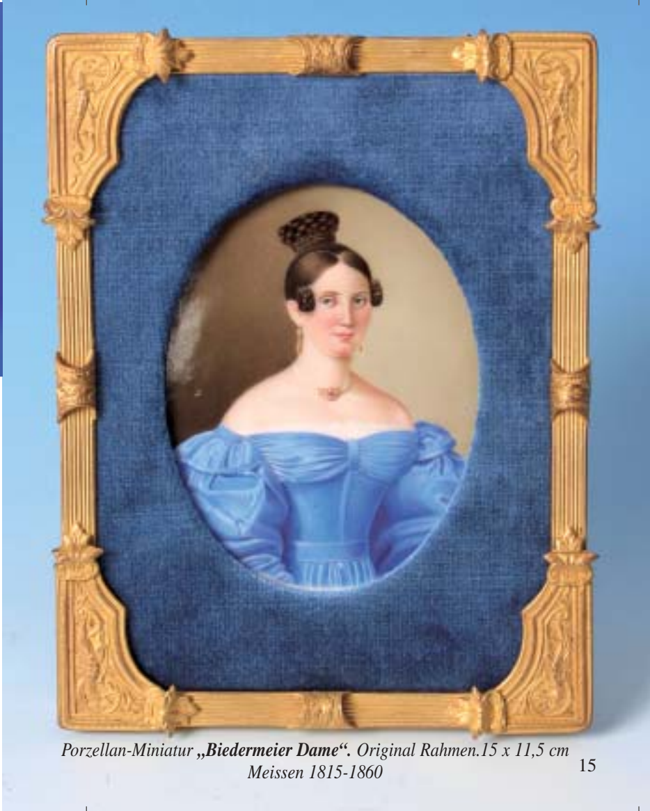
Porzellan-Miniatur „Biedermeier Dame“. Original Rahmen. 15 x 11,5 cm Meissen 1815-1860