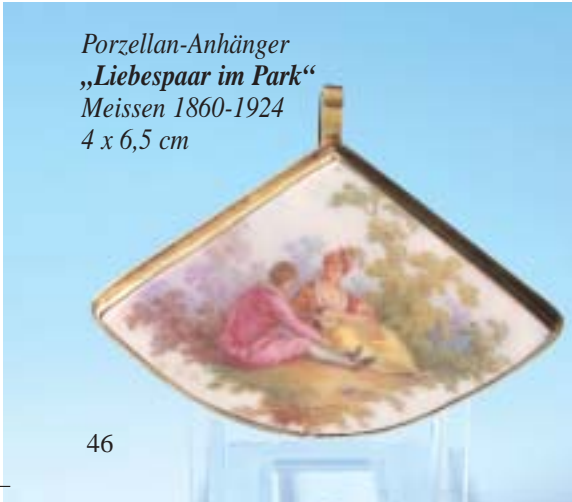
Porzellan-Anhänger „Liebespaar im Park“ Meissen 1860-1924 4 x 6,5 cm