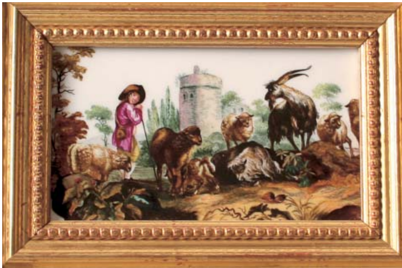
Porzellan- Gemälde „Hirte mit seinen Tieren“

Bemalung v. J.C. Mauksch 1750-1760 26 x 32 cm