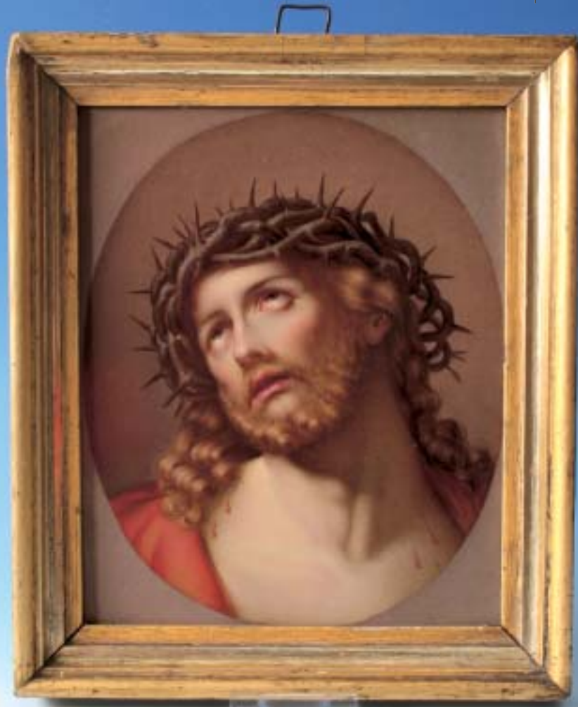
Porzellan-Gemälde „Jesus mit Dornenkrone“ 28 x 24 cm Meissen 1815-1860