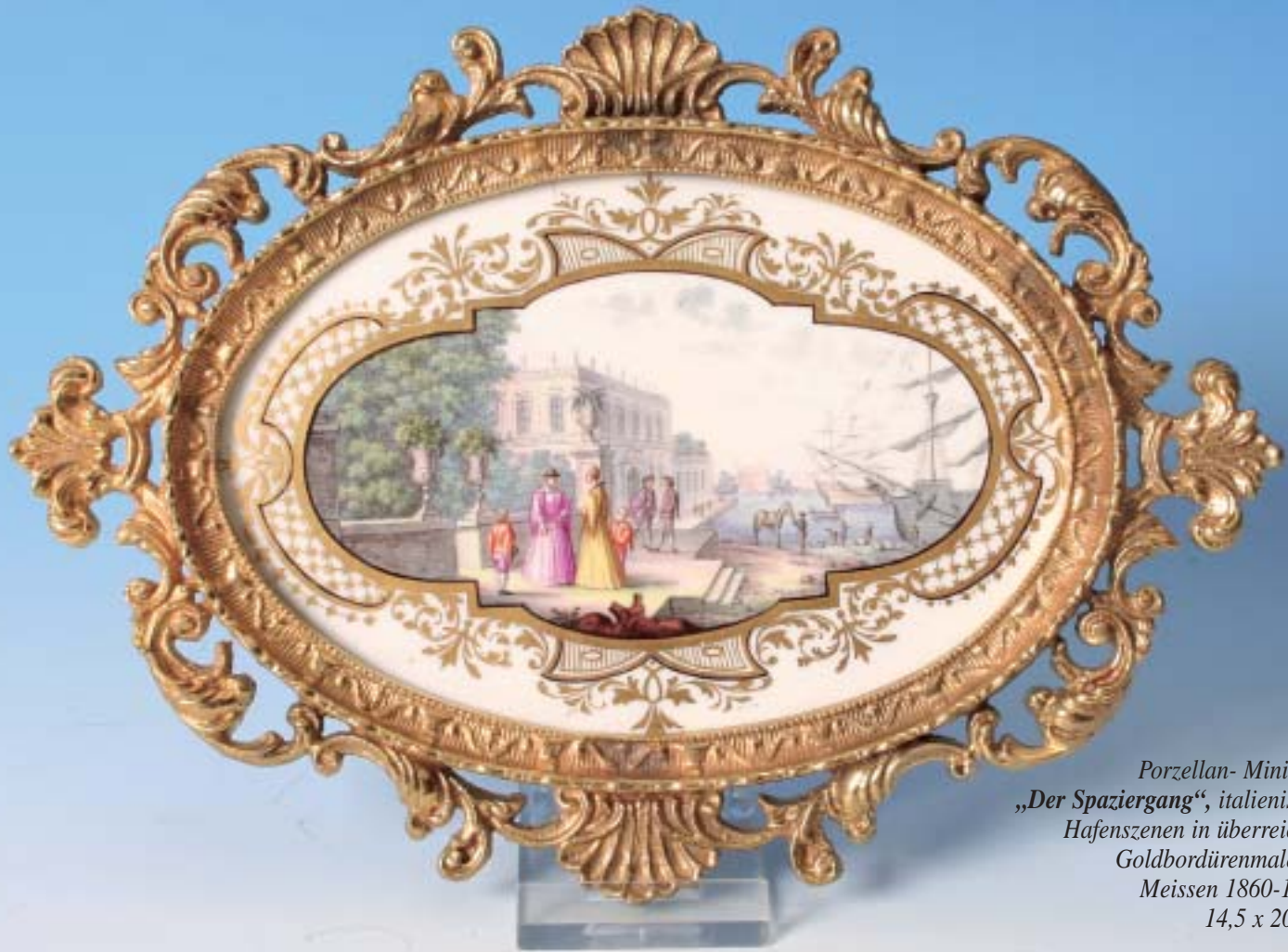
Porzellan- Miniatur „Der Spaziergang“, italienische Hafenszenen in überreicher Goldbordürenmalerei. Meissen 1860-1924 14,5 x 20 cm