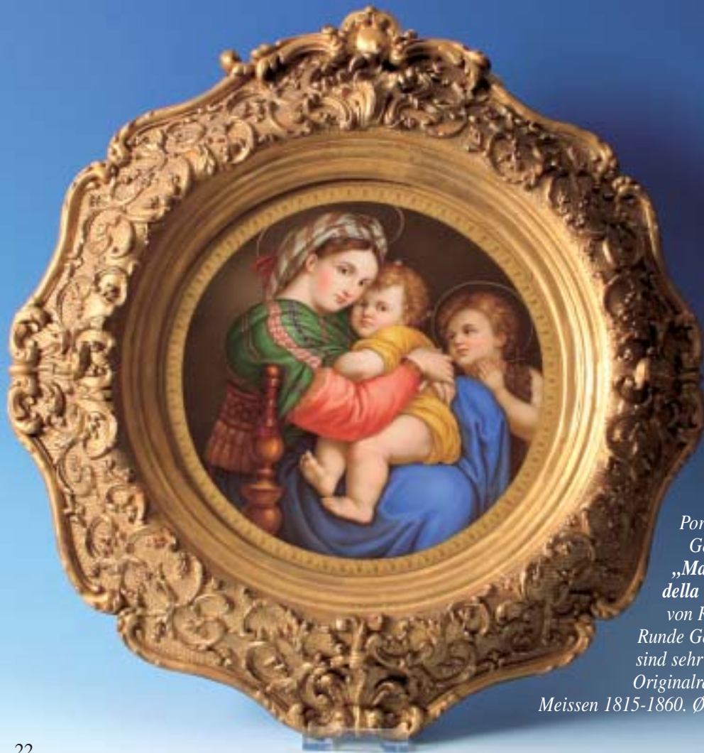
Porzellan- Gemälde „Madonna della Sedia“ von Raffael. Runde Gemälde sind sehr selten. Originalrahmen. Meissen 1815-1860. Ø 37 cm