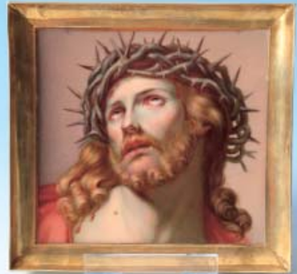
Porzellan-Miniatur „Jesus mit Dornenkrone“ Beamtenporzellan Meissen 1815-1860 11 x 11 cm