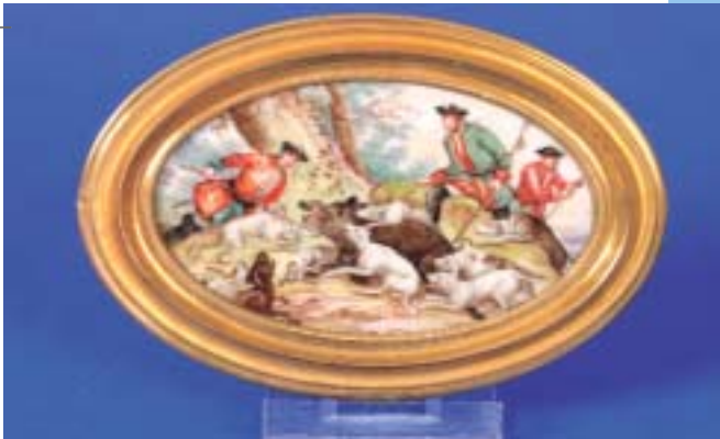
Porzellan- Miniatur „Die Saujagd“ (Sächsische Hoffjäger) Meissen 1815-1860 (ungemarkt) 7,5 x 10 cm