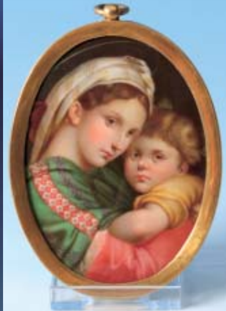
Anhänger „Maria mit dem Jesuskind“ Meissen 1815-1860 8,5 cm x 6,5 cm