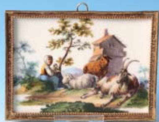
Porzellan-Miniatur „Schäferin“ Meissen 1815-1860 9 x 12,5 cm