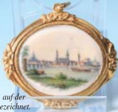
Porzellan- Anhänger „Dresden“, auf der Rückseite bezeichnet. Meissen 1815-1860 4 x 5 cm