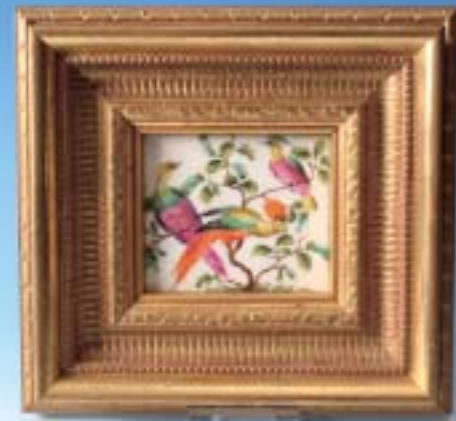
Porzellan- Miniatur „Exotische Paradiesvögel“ Meissen 1815-1860 20 x 21,5 cm