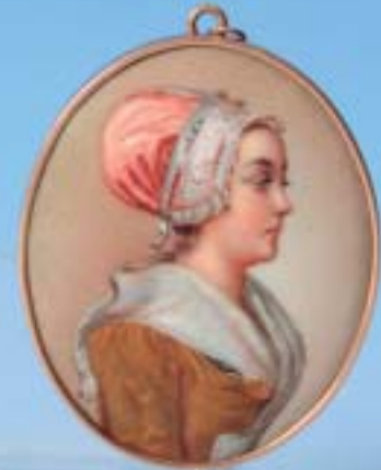
Porzellan-Anhänger „Schokoladenmädchen“ von Jean Étienne Leotard. Goldfassung. Meissen 1860-1924 Ø 5 cm