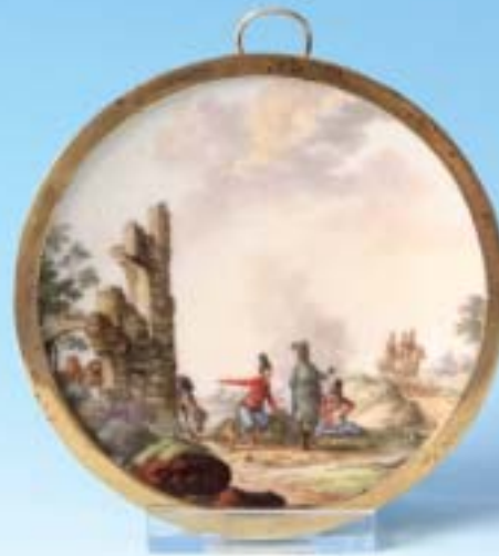
Porzellan- Miniatur „Die Rast“ Meissen 1774-1814 Ø 8,5 cm