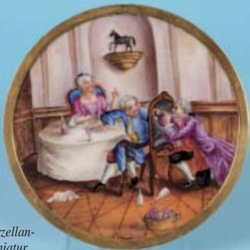
Porzellan- Miniatur „Zimmerinterieur“ Hausmalerei Meissen 1860-1924. Ø 11 cm