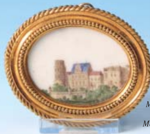
Porzellan- Miniatur-Gemälde „Heidelberg“ Meissen 1815-1860 6 x 7,5 cm