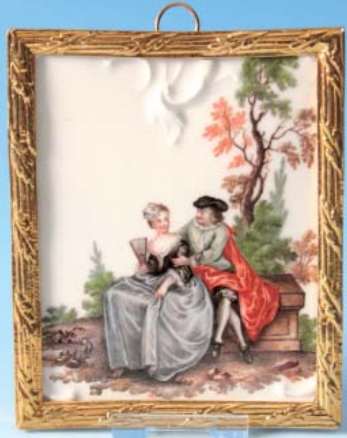
Porzellan-Miniatur „Höfisches Paar im Park“ , n. A. Watteau. Meissen 1740-1750 ohne Marke 13 x 9,5 cm