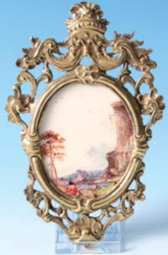
Porzellan-Miniatur „Kauffahrteiszene“ Meissen 1740-1760 15 x 9 cm