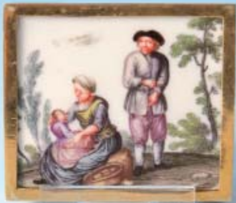
Porzellan- Miniatur „Bäuerliche Szene“ Meissen 1750-1760 5,5 x 6 cm