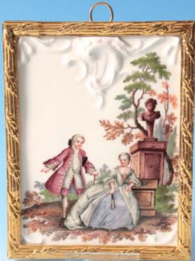
Porzellan-Miniatur „Höfisches Paar im Park“ , n. A. Watteau. Meissen 1740-1750 ohne Marke 11 x 10 cm