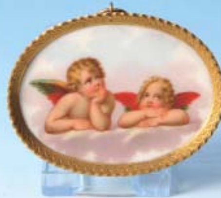
Porzellan-Anhänger „Botticelli-Engel“, aus der Sixtinischen Madonna. Meissen 1815-1860 Ø 7 cm 47