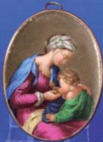
Porzellan Miniatur „Mutter mit Kind“ Meissen 1815-1860 6,5 x 5 cm