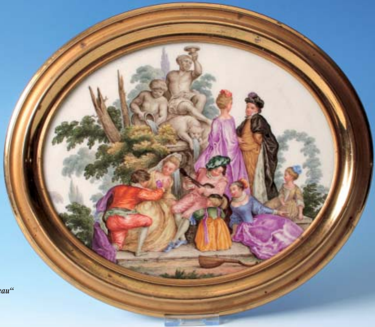
Porzellan-Gemälde „Szene nach A. Watteau“ Meissen 1740-1760 Ø 28 cm