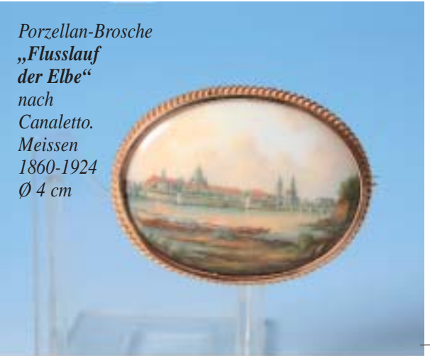
Porzellan-Brosche „Flusslauf der Elbe“ nach Canaletto. Meissen 1860-1924 Ø 4 cm