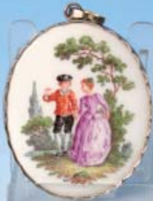
Porzellan-Anhänger „Höfisches Paar im Park“ Meissen 1935-1945 Ø 5 cm