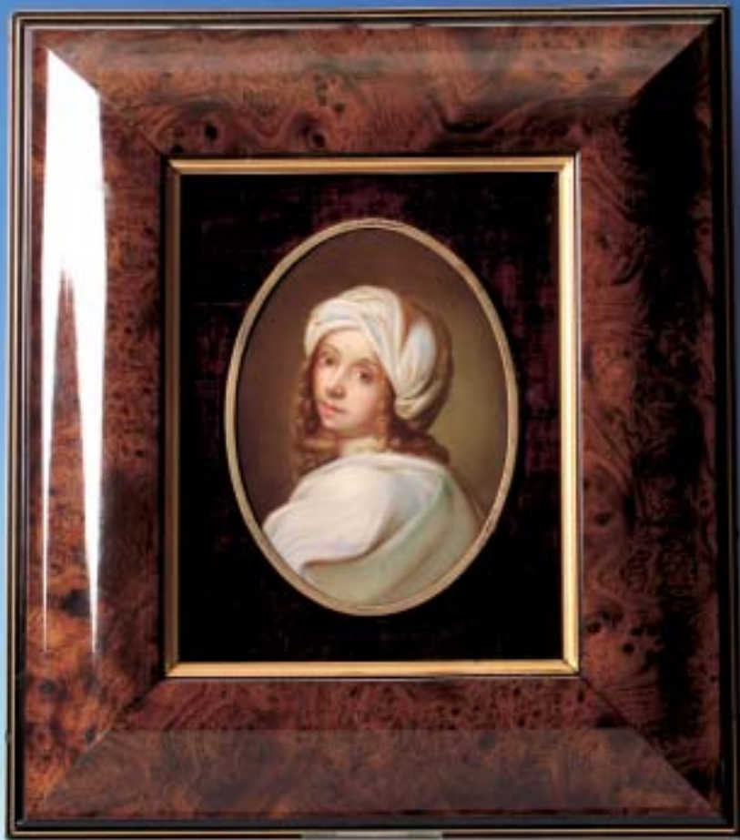
Porzellan-Miniatur „Portraitist Beatrice Cenci“ 33,5 x 29 cm Meissen 1860-1924