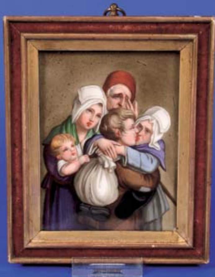
Porzellan-Gemälde „Der Abschied“ Auf der Rückseite Original Verkaufsetikett. Meissen 1815-1860 14,5 x 10,5 cm