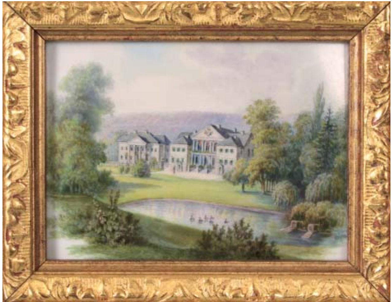
Porzellan-Miniatur „Meininger Palais und Schlossgarten“, Meissen 1815-1860 18 x 23 cm