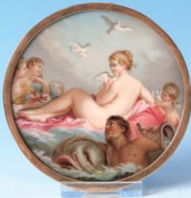
Porzellan- Miniatur „Neptun und Venus“. Goldrahmen. Meissen 1815-1860 Ø 9,5 cm