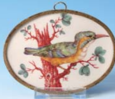
Zwei Porzellan-Miniaturen „Vögel mit buntem Federkleid“ Meissen 1815-1860 Ø 12 cm