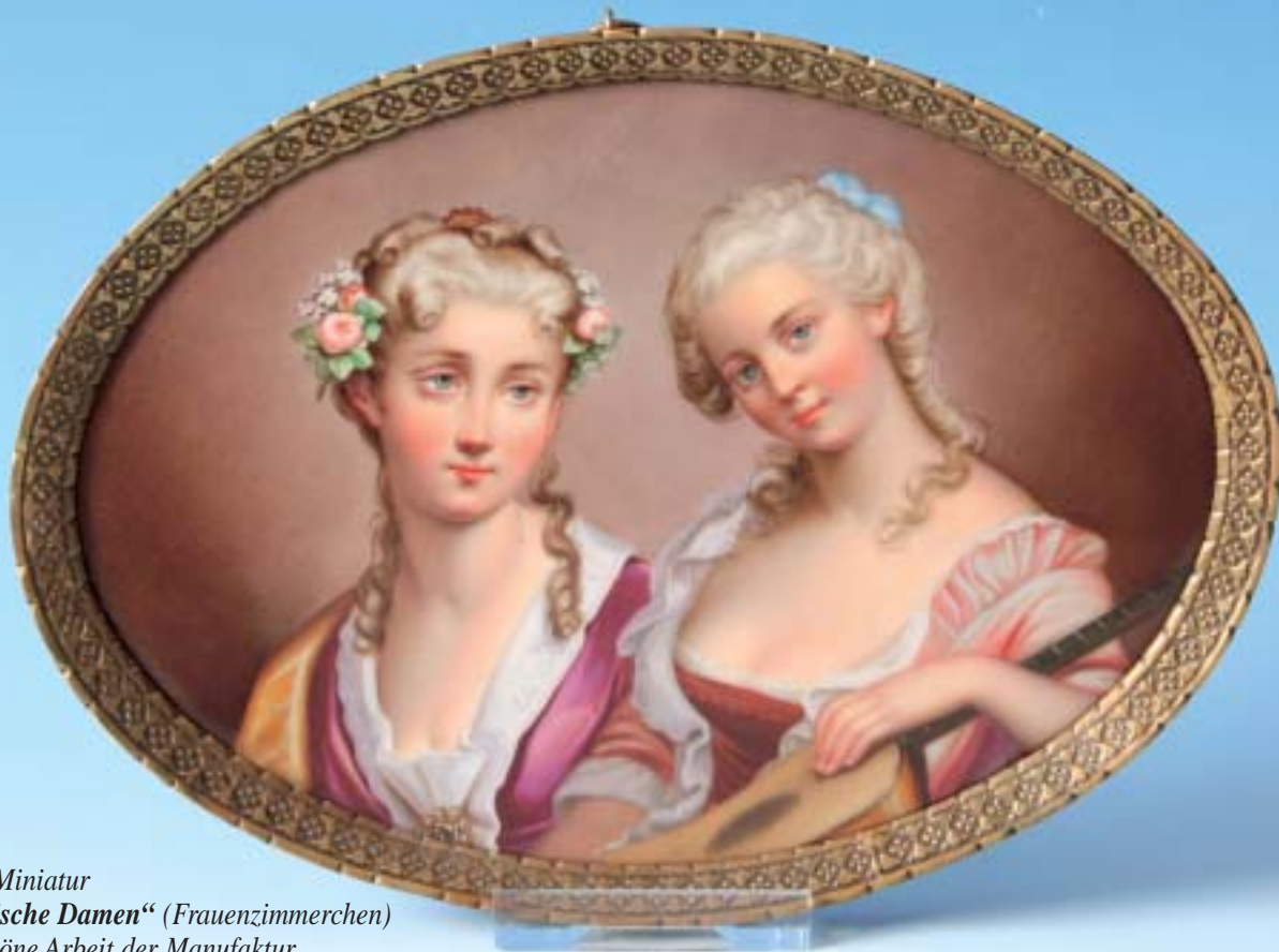
Porzellan-Miniatur „Zwei höfische Damen“ (Frauenzimmerchen) Wunderschöne Arbeit der Manufaktur. Meissen 1815-1860 12 x 16 cm