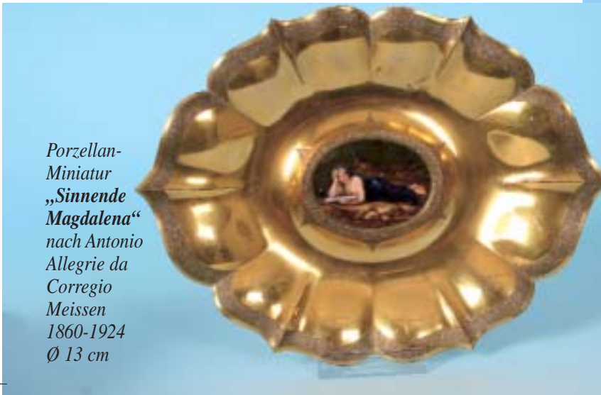
Porzellan- Miniatur „Sinnende Magdalena“ nach Antonio Allegrie da Corregio Meissen 1860-1924 Ø 13 cm