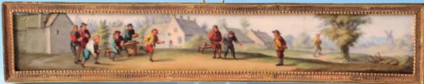
Bedeutende Porzellan-Miniaturen „Holländische , bauerliche Szenen“, n. Tenniers Solche Sonderanfertigungen waren sehr selten. Meissen 1815-1860. 4 x 24 cm