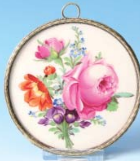
Runde Porzellan- Miniatur „Blumenbukett“ bunt staffiert. Meissen 1774-1814 Marcolinizeit Ø 8,5 cm