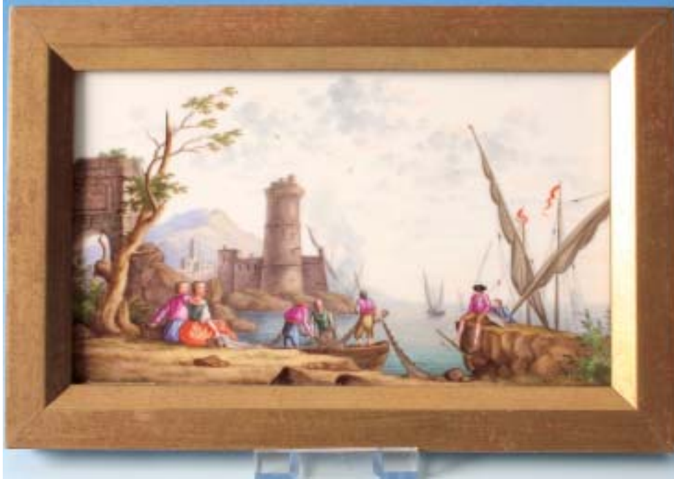
Porzellan-Gemälde Kauffahrteiszenen „Handel und Wandel“ Hausmalerei. Meissen 1860-1924 16 x 23 cm