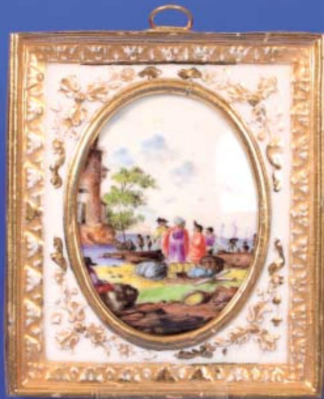
Miniatur „Kaufahrteizene“, im Porzellanrahmen Hausmalerei. Meissen 1815-1860 11,5 x 10 cm