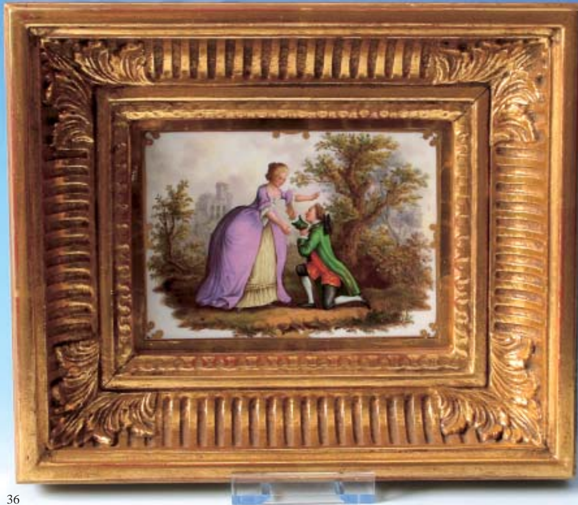
Porzellan-Gemälde „Der Antrag“ n. A. Watteau. Meissen 1815-1860 19 x 21 cm