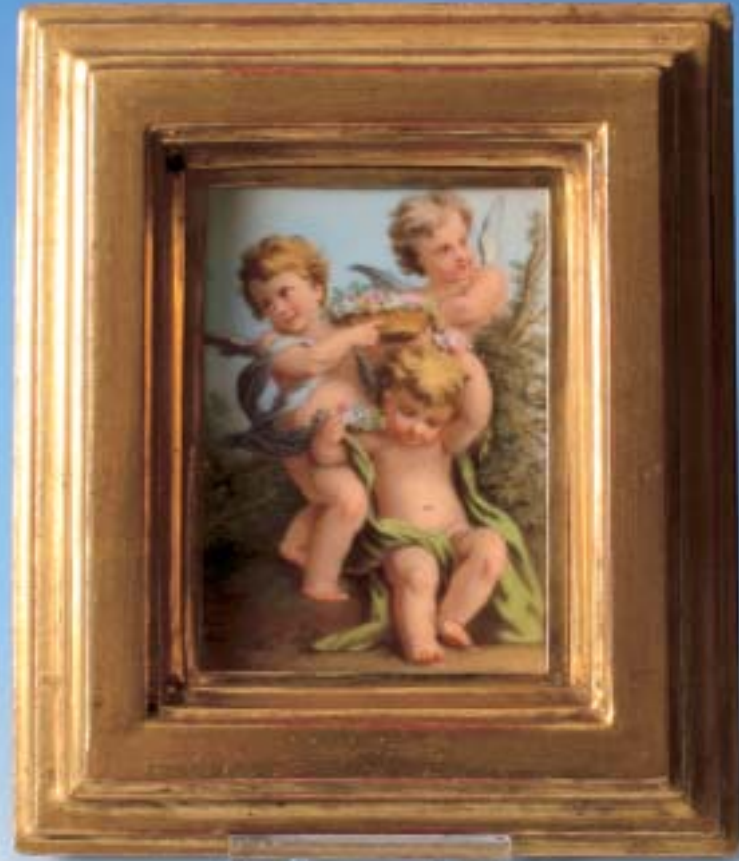
Porzellan-Miniatur „Spielende Putten“ nach Francois Boucher Meissen 1815-1860 17 x 14 cm