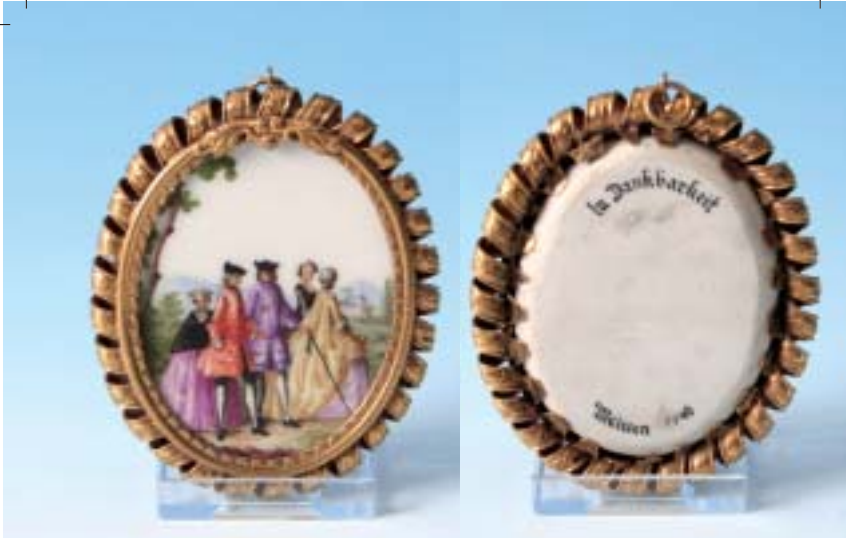
Porzellan-Miniatur „Höfische Gesellschaft“ 8 x 6 cm Meissen 1740 datiert