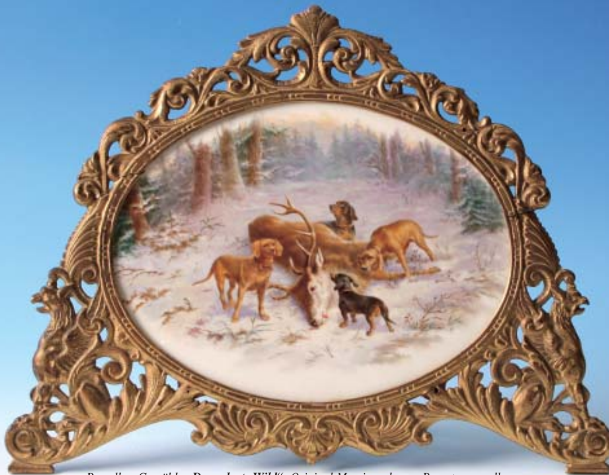
Porzellan-Gemälde „Das erlegte Wild“. Original Messingrahmen, Beamtenporzellan Meissen 1860-1924 22 x 30 cm