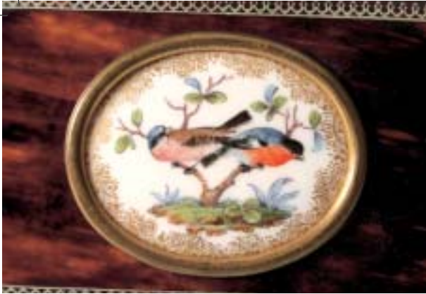
Porzellan-Miniatur auf Etui, sehr selten. Ovale Miniatur „Heimische Singvögel“ Meissen 1815-1860 7 x 13 cm