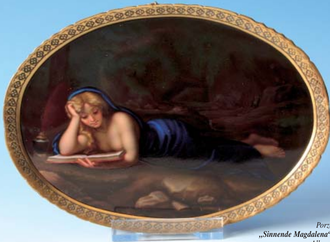
Porzellan-Miniatur „Sinnende Magdalena“ nach Antonio Allegri da Corregio Meissen 1860-1924 13 x 16 cm