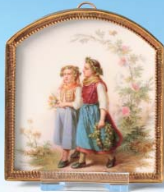
Porzellan-Miniatur „Die Schwestern“ Meissen 1815-1860 11 x 10 cm