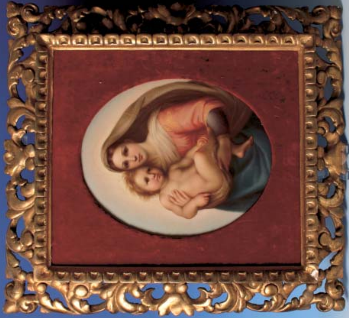
Porzellan-Gemälde Ausschnitt aus der „Sixtinischen Madonna“ von Raffael. Original holzgeschnitzter Rahmen. Meissen 1815-1860 53 x 50 cm