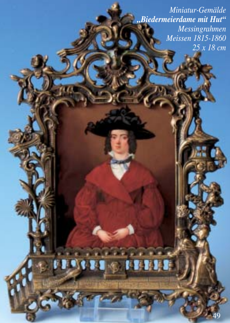
Miniatur-Gemälde „Biedermeierdame mit Hut“ Messingrahmen Meissen 1815-1860 25 x 18 cm