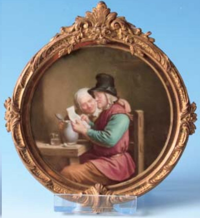
Porzellan-Miniatur „Holländische Wirtshausszene“ n. einem Gemälde von Teniers. Messingrahmen. Meissen 1860-1924 14 x 13 cm