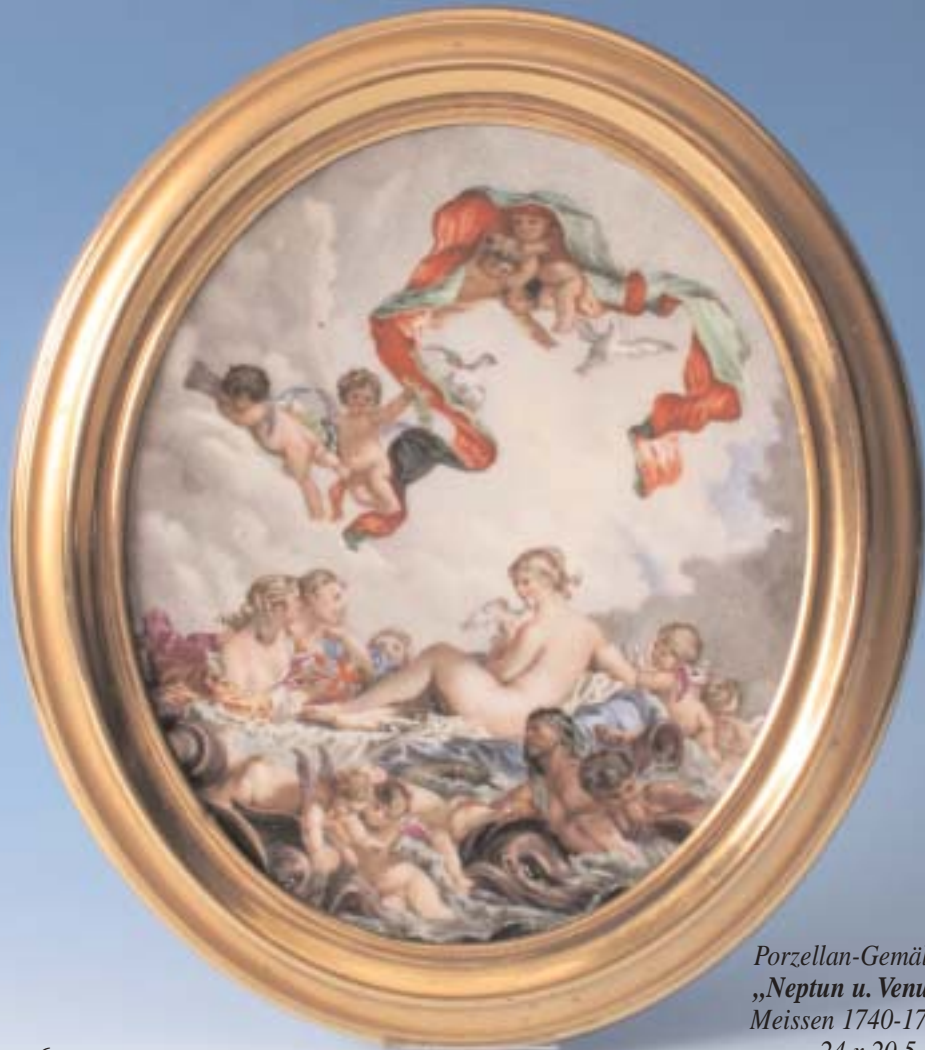
Porzellan-Gemälde „Neptun u. Venus“ Meissen 1740-1760 24 x 20,5 cm