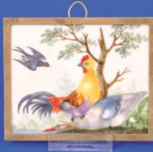
Porzellan-Miniatur „Hahn und Ente“ Messingrahmen vergoldet Meissen 1774-1814 8 x 9,8 cm