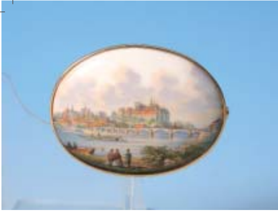
Porzellan-Brosche „Ansicht von Meissen“ Meissen 1860-1924. Ø 4 cm