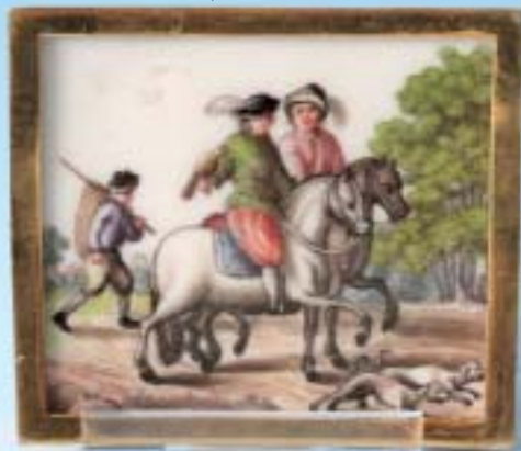
Porzellan-Miniatur „Der Ausritt“ Meissen 1750-1760 5,5 x 6 cm