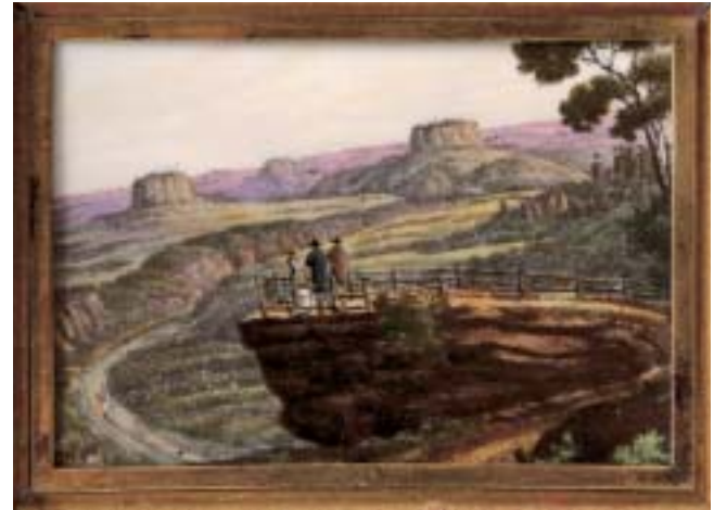
Porzellan-Miniaturen 22 x 24,5 cm „Aussichts-Plattform auf der Bastille im Elbsandsteingebirge“ Meissen 1815-1860