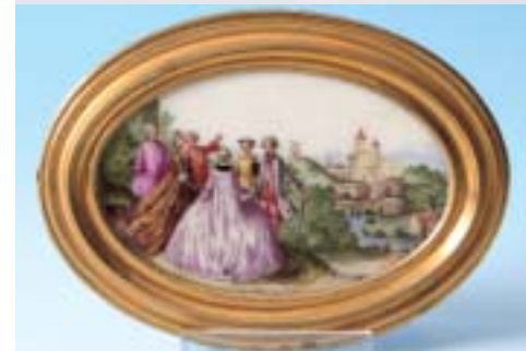
Porzellan-Miniatur „Höfische Gesellschaft beim Spaziergang“ Meissen 1740-1760 ohne Marke 7 x 10 cm