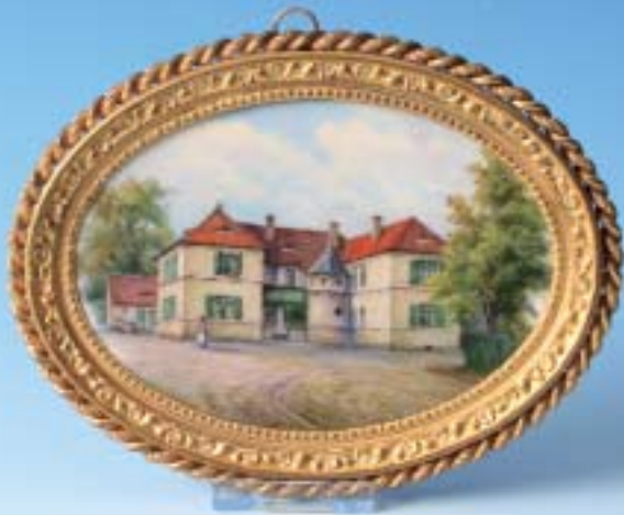
Salzmünde. auf der Rückseite beschrieben