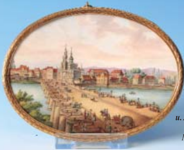
Porzellan-Miniatur „Dresden mit Hofkirche, Schloß u. Augustusbrücke“, Hausmalerei. Meissen 1860-1924 Ø 14 cm