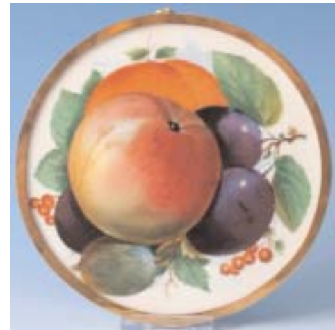
Porzellan-Miniatur „Früchtestilleben“ Meissen 1815-1860 14 cm