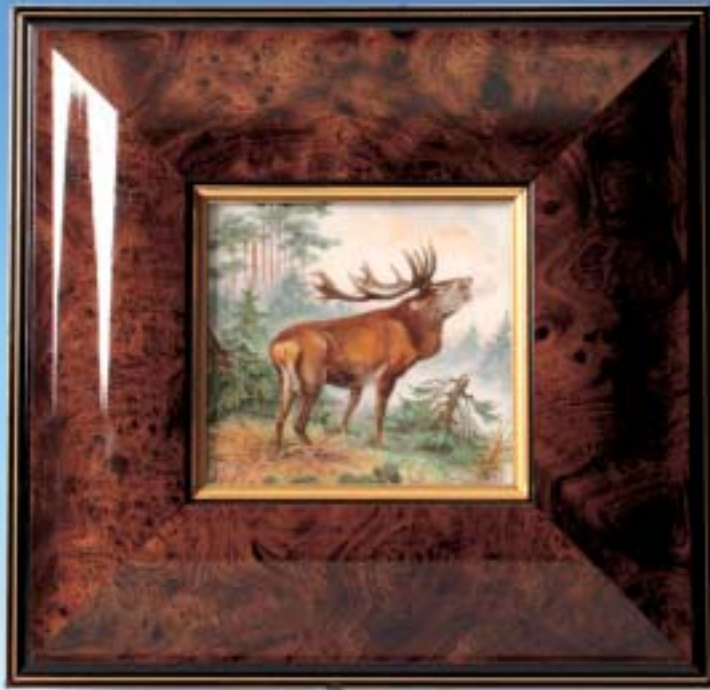
Porzellan-Miniatur „Platzhirsch“ Meissen 1935-1945, Beamtenporzellan 24 x 24,5 cm