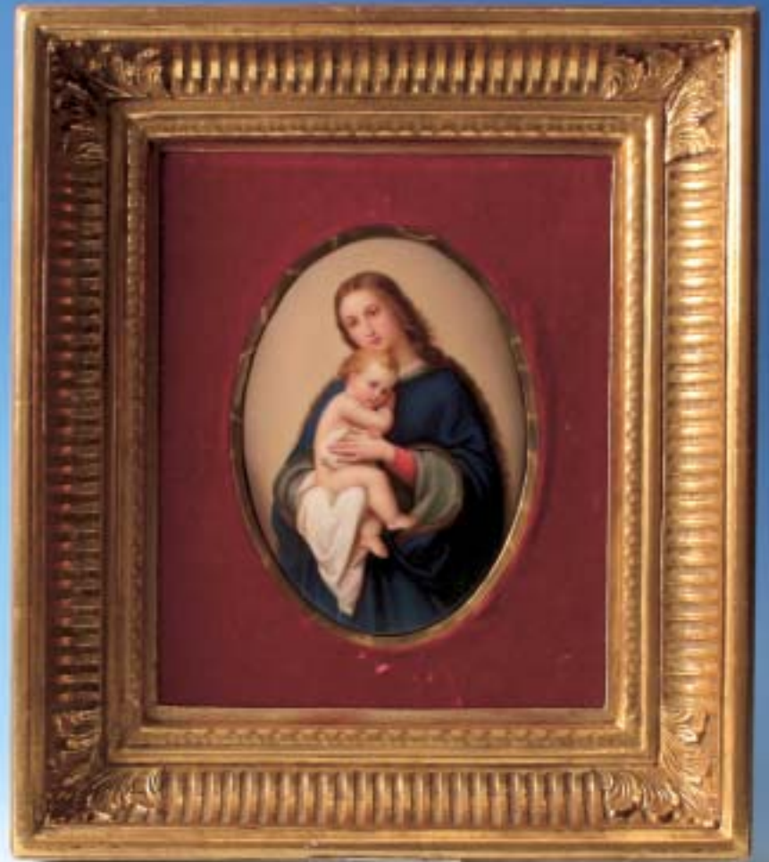
Porzellan Gemälde „Madonna mit dem Jesuskind“ 30 x 27 cm. Meissen 1815-1860.