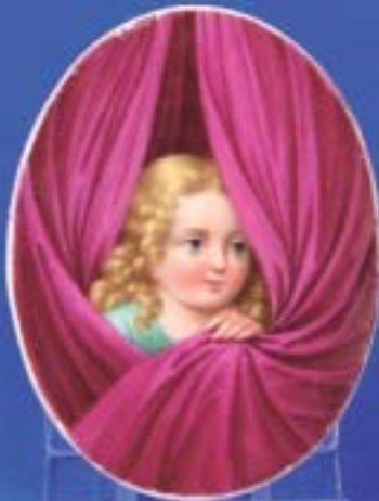
Porzellan-Miniatur „Kinderportrait“ Meissen 1815-1860 6,5 x 5 cm