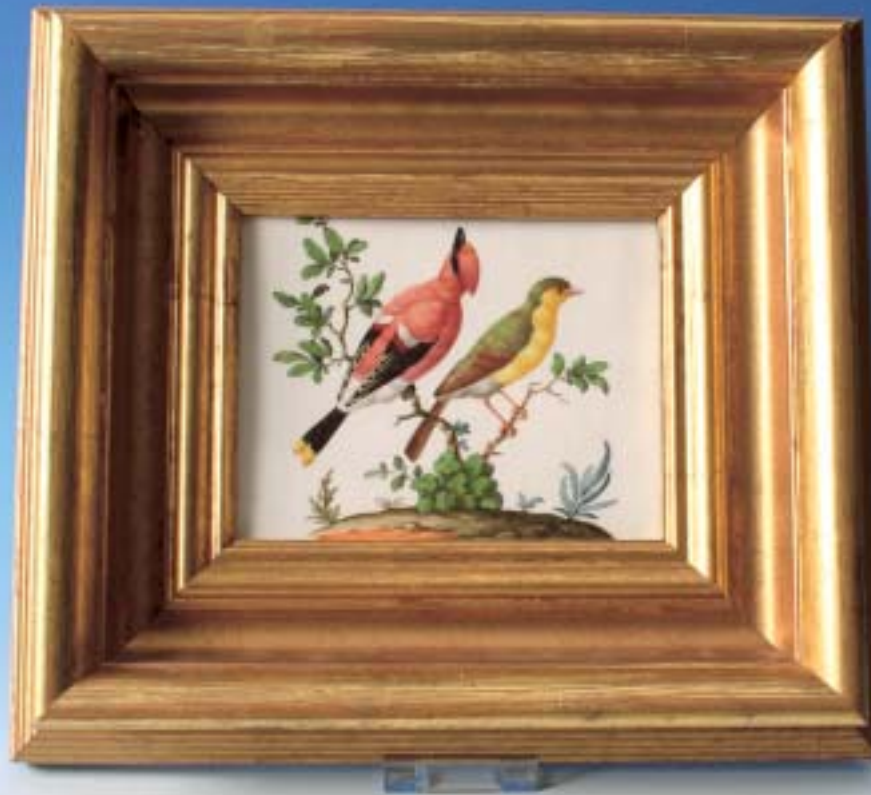
Porzellan-Gemälde „Heimische Singvögel auf einem Zweig sitzend“ Meissen 1763-1774 28 x 31 cm