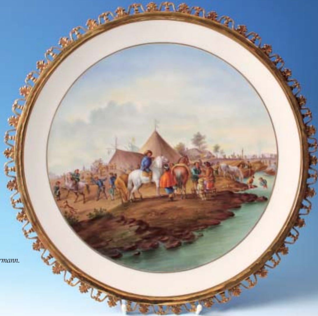
Rundes Porzellan Gemälde „Bataillenszene“ n. Wouwermann. Hausmalerei. Rahmen Messing vergoldet. Meissen 1935-1945 Ø 35 cm