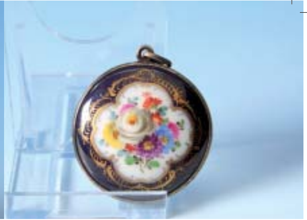
Porzellan-Anhänger „Blumengebinde“ Meissen 1924-1934 Ø 3,5 cm