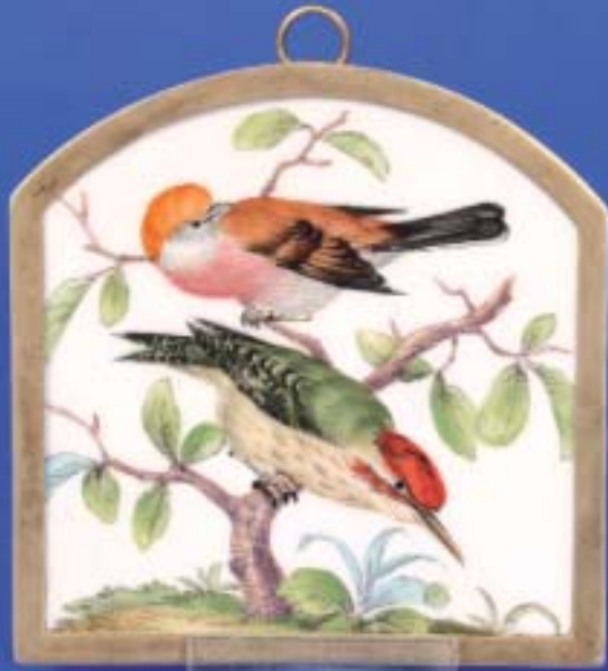
Porzellan-Miniatur „Specht mit Singvogel“ Meissen 1860-1924 9 x 9 cm