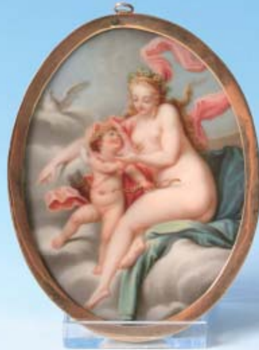
Porzellan- Miniatur „Venus und Amor“. Goldrahmen. Meissen 1815-1860 9 x 7 cm