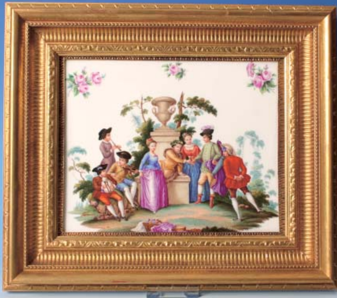
Porzellan-Gemälde „Höfische Gesellschaft lustwandelnd im Park“, n. A. Watteau. Meissen 1815-1860 21,5 x 25 cm