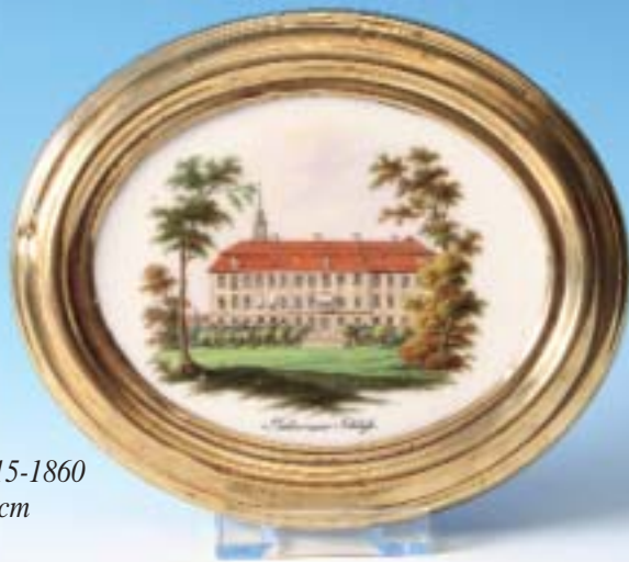
Porzellan- Miniatur „Liebmoser Schloß“, Meissen 1815-1860 13,5 x 15,5 cm