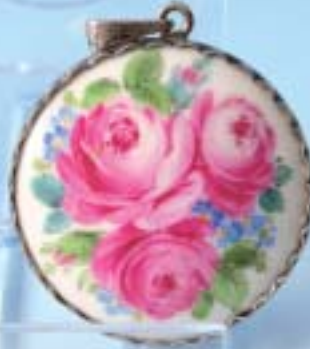
Porzellan-Anhänger „Rosenbukett u. Veilchen“ Meissen 1935-1945 Ø 3,5 cm