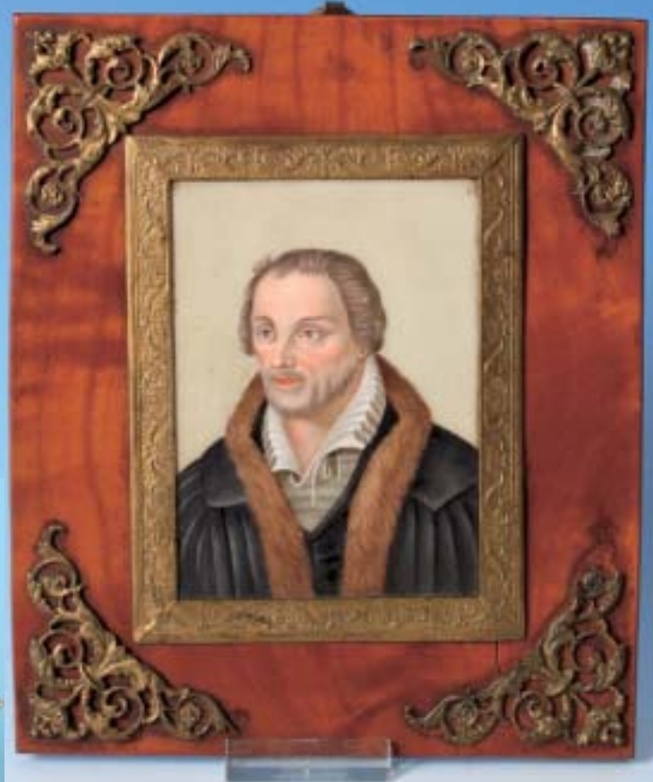
Porzellan- Miniatur Brustbild von „Philip Melancthon“ Rahmen Kirschholz mit Messingverzierung Meissen 1815-1860 18 x 16 cm