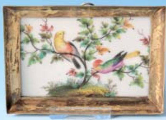
Porzellan- Miniatur „Paradiesvögel“ Meissen 1815-1860 7,5 x 10,5 cm