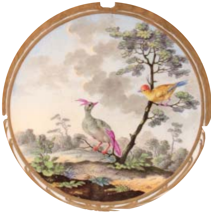
Porzellan-Miniatur „Exotische Vögel, in Landschaft“ Meissen 1763-1774 13,5 x 12,5 cm