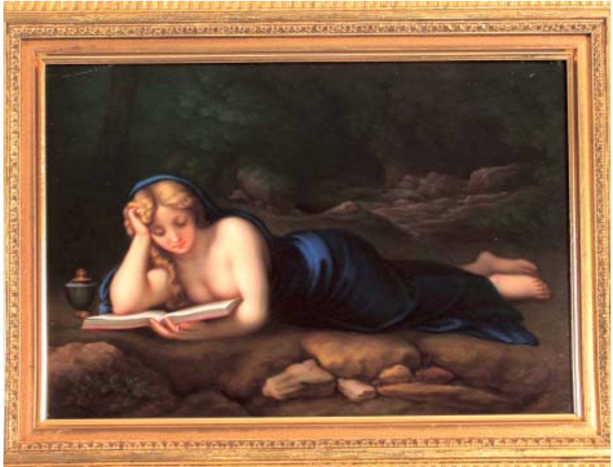
Porzellan- Gemälde „Sinnende Magdalena“ nach Antonio Allegri da Corregio. Original- rahmen. Meissen 1860-1924 40 x 32 cm